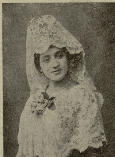
Una bailarina bien de las que han de ocupar un primer puesto.

poco a poco destroza el espíritu y nos hace aborrecer al hombre, hasta el extremo de no considerarle sino como el guardador de dinero que, a fuerza de fingir, hemos de sacar de su bolsillo, para seguir presentándonos ante él y excitar su deseo... ¡Oh!... ¡Es una odiosa cadena sin fin, que atamos a nuestro cuello al dar el primer paso en nuestra vida, de eslabones iguales siempre, pesados, repugnantes, que aniquilan... Más champagne... Y con tus labios. No quiero beber en otra copa hasta que, harta de vino, haga brotar de un mordisco la sangre de los bordes.