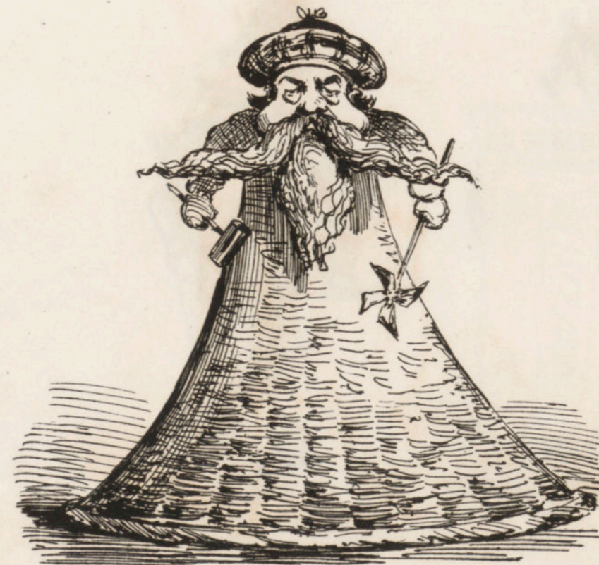
El niño Zangolotino.