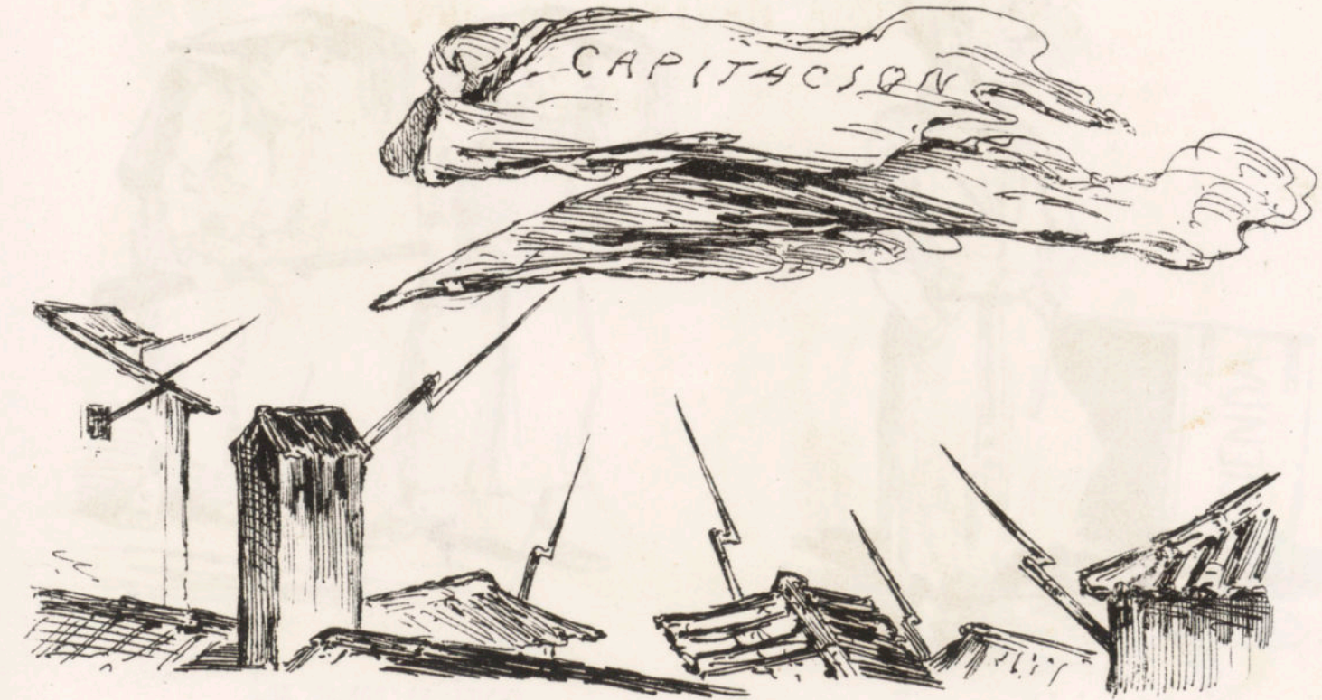
El alma de Garibay