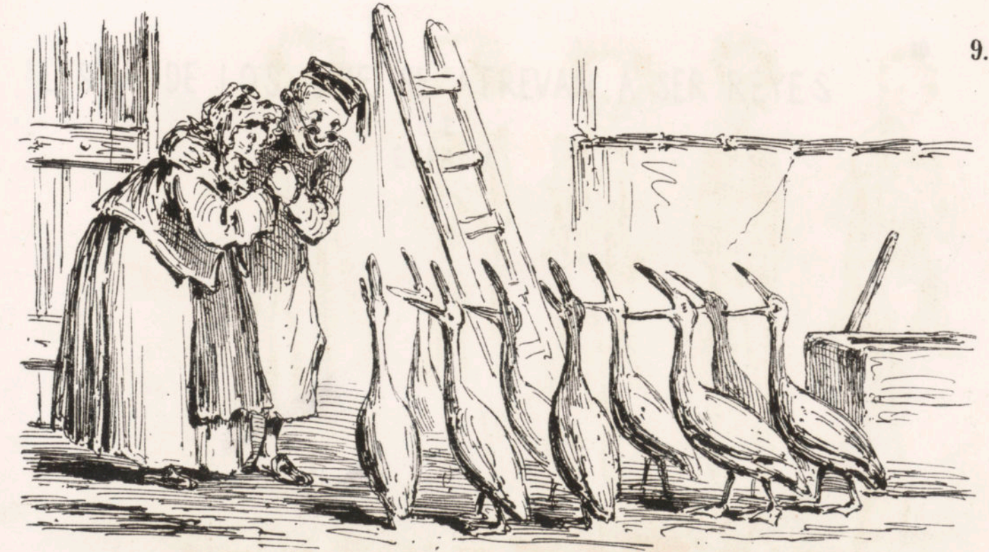
—Mira que contentos están los picarillos, creyendo que sus plumas van á servir para firmar la Constitucion.