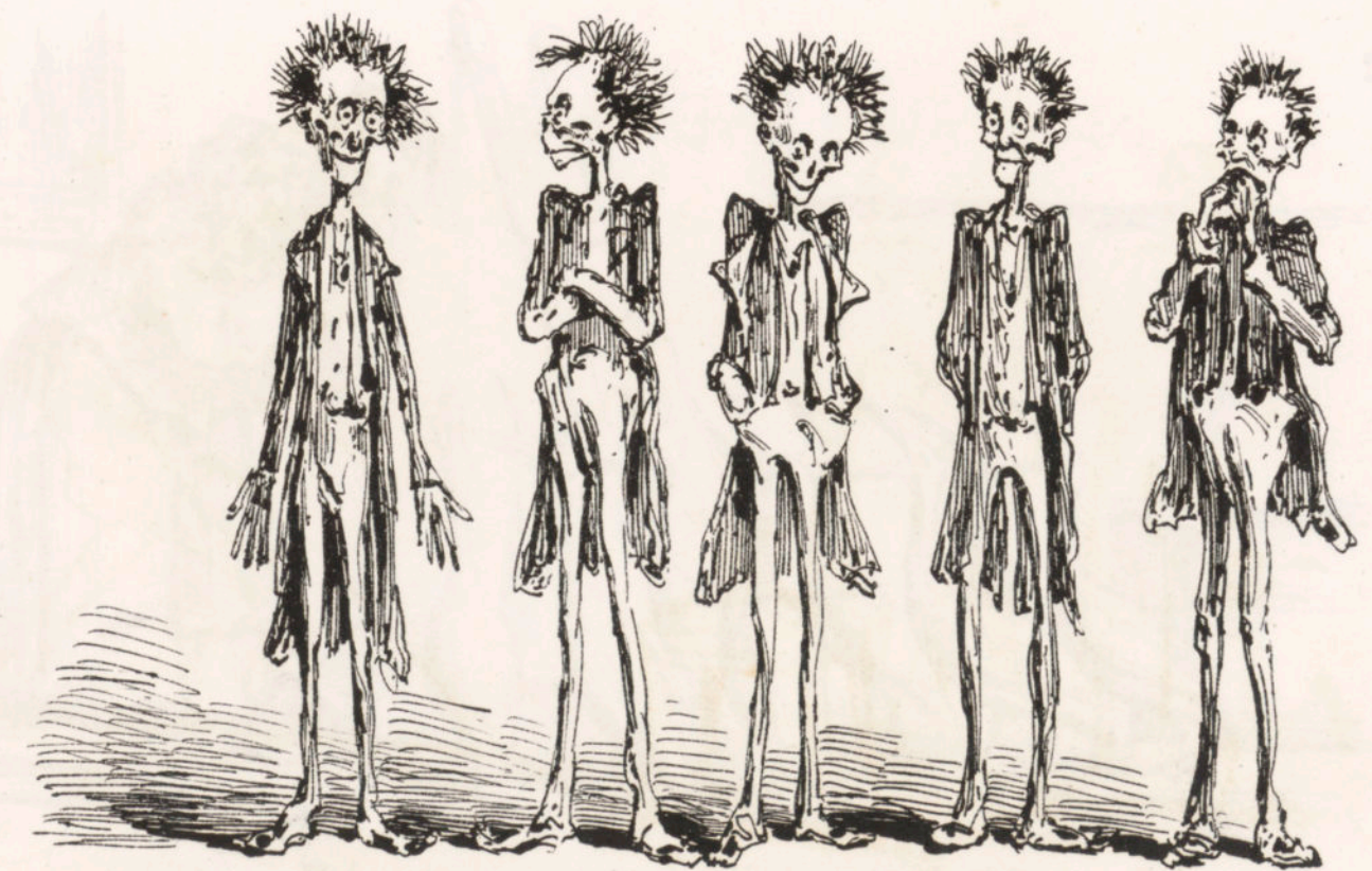
Aspecto que presentarán los empleados que no firmen la Constitución.