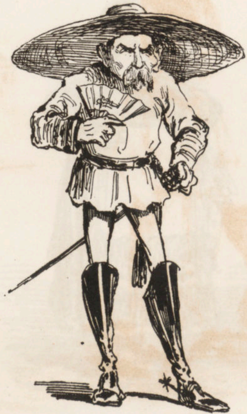
La espada de Bernardo.