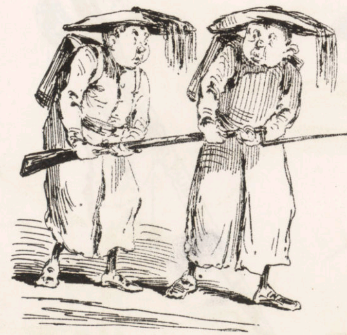
Los galgos de Lucas.