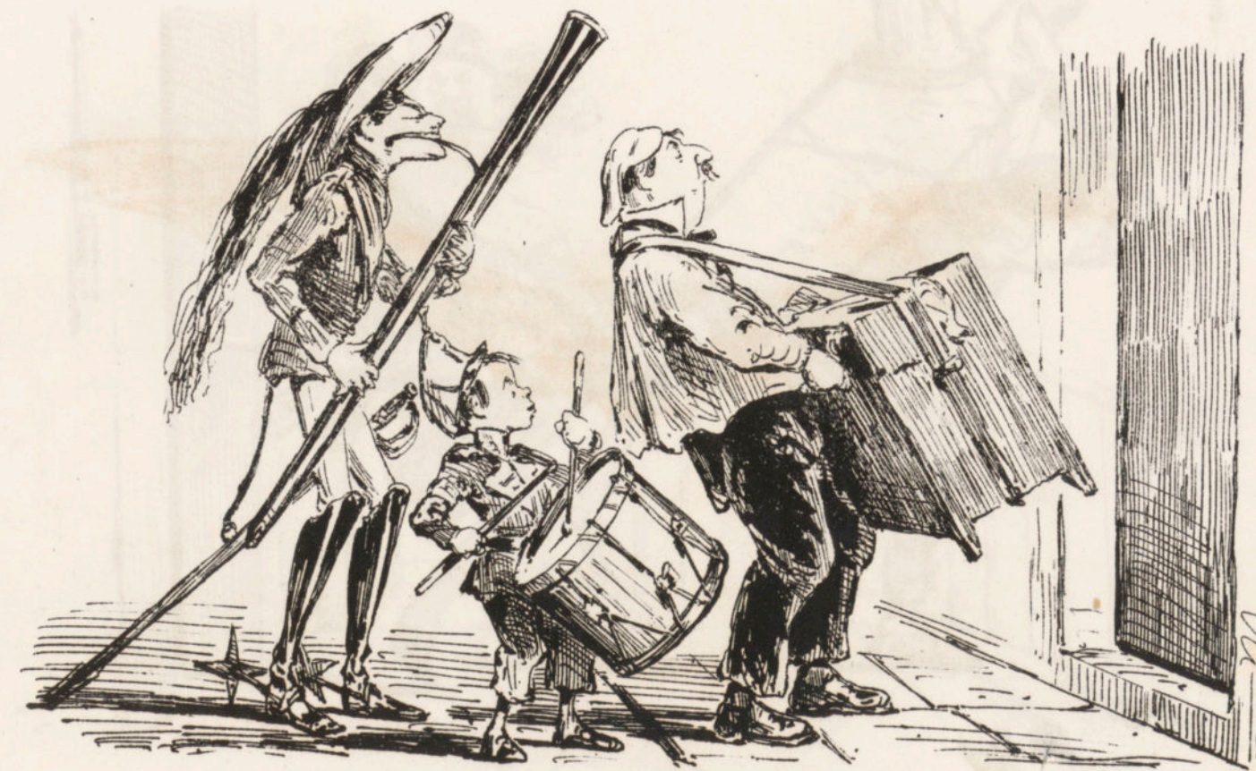
Murga régia con motivo de haberse votado la monarquía.