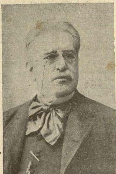
EXCMO. SR. D. JUAN VALERA

Y, por fin, de Academias americanas, las cuales, según acuerdo de la Española, tomado en 24 de Noviembre de 1870, se podrán erigir en las que antiguamente fueron provincias de