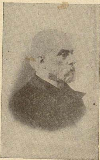
EXCMO. SR. D. VÍCTOR BALAGUER