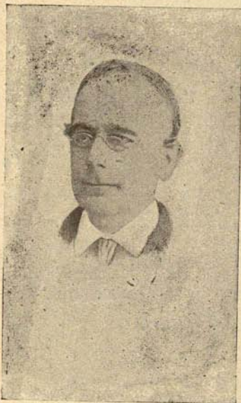
EXCMO. SR. D. EDUARDO BENOT