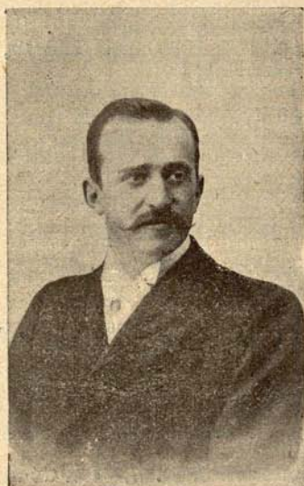
EXCMO. SR. CONDE DE ROMANONES Alcalde de Madrid.