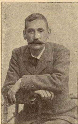
Sr. D. BENITO PÉREZ GALDÓS