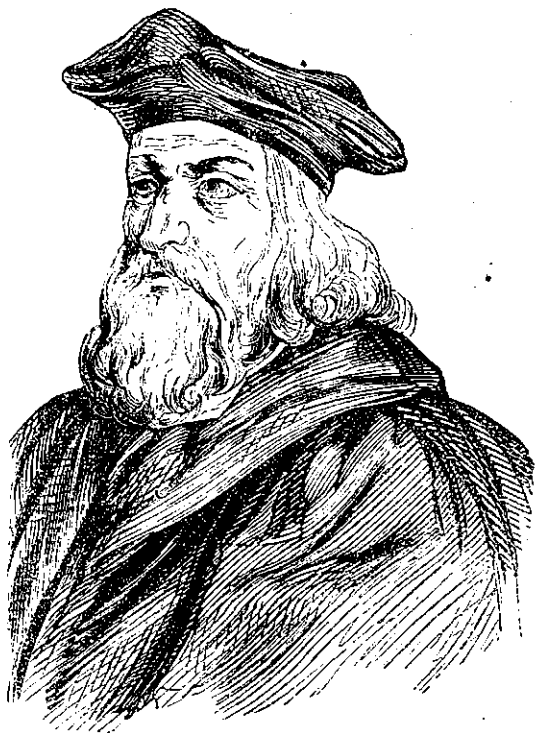
Gerónimo de Praga.

PRAGA.—Juan Huss y Gerónimo de Praga, na- ció en Bohemia en 1370, de padres de la hez del pueblo. Sus intrigas, que eran iguales a sus ta- lentos, le sacaron de la oscuridad en que yacía, y ascendió a rector de la universidad de Praga y a confesor de Sofia de Baviera, esposa de Wenceslao, rey de Bohemia, con la cual tenia mucho influjo. El herejarca Wicel había em- pezado a predicar sus errores poco tiempo antes, y Juan Huss, leyendo sus libros, adquirió en ellos sus perniciosas doctrinas y adoptó todas las máximas del delirante inglés contra la igle- sia romana. Sus opiniones fueron denunciadas al papa Juan XXIII, y habiéndosele citado para que compareciese ante S. S. en 1411, se negó abiertamente a ello. Reunióse el concilio de Constanza, y el emperador Segismundo, herma- no de Wenceslao, rey de Bohemia, persuadió a Huss a que fuese a defenderse ante aquella respetable asamblea. El herejarca bohemio se presentó en 1414 con toda la confianza de un hombre que no tiene nada que le echen en ca- ra. Así que llegó le oyeron los PP., y al fin de la segunda audiencia ofreció retractarse con tal que se le enseñase alguna cosa mejor que lo que había dicho; proposicion que ocultaba un orgullo y una terquedad inaguantables. El herejarca persistió siempre en sus errores, y el concilio, vista su obstinacion, le condenó en la quin- cuagésima sesion a ser degradado y que se que-