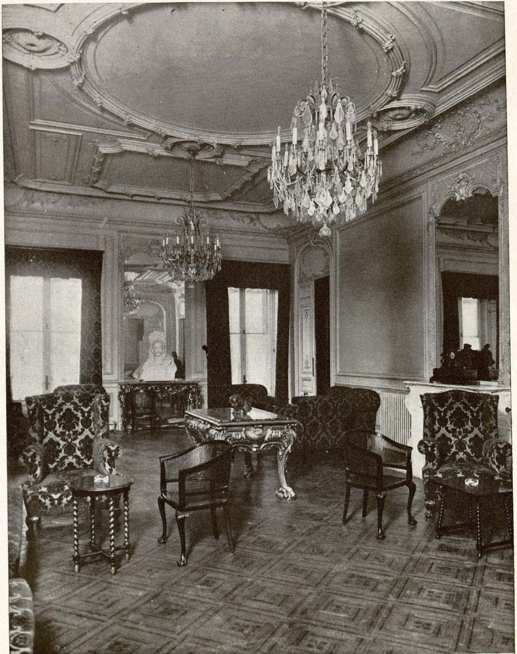
Casa Palacio.—Salón de visitas.