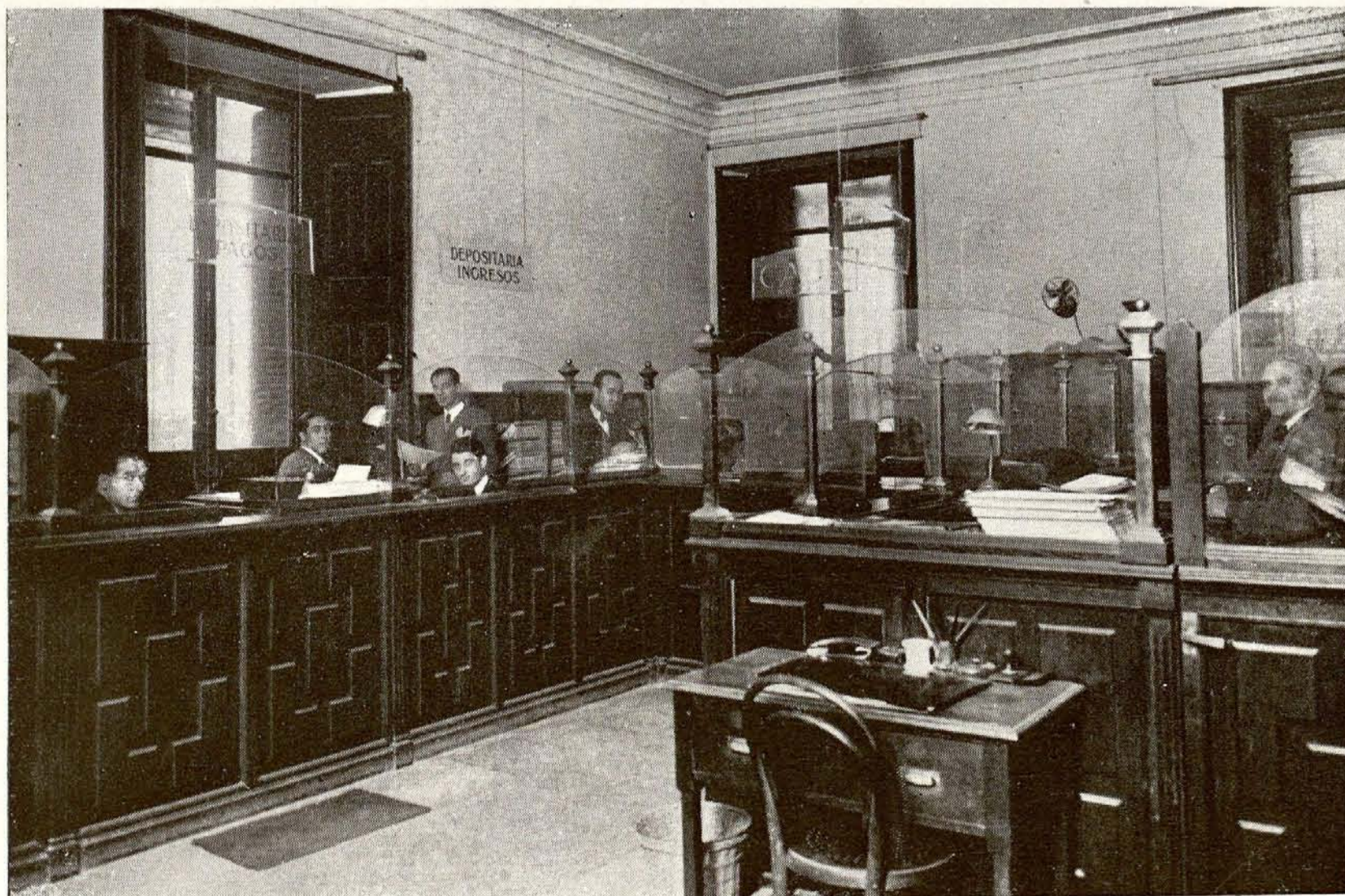
Casa Palacio. —Una de las oficinas de caja.