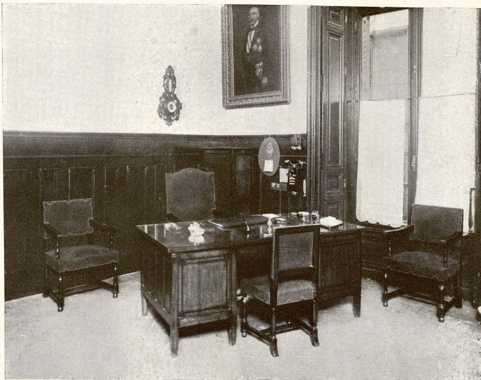
Casa Palacio. —Despacho del Secretario de la corporación.