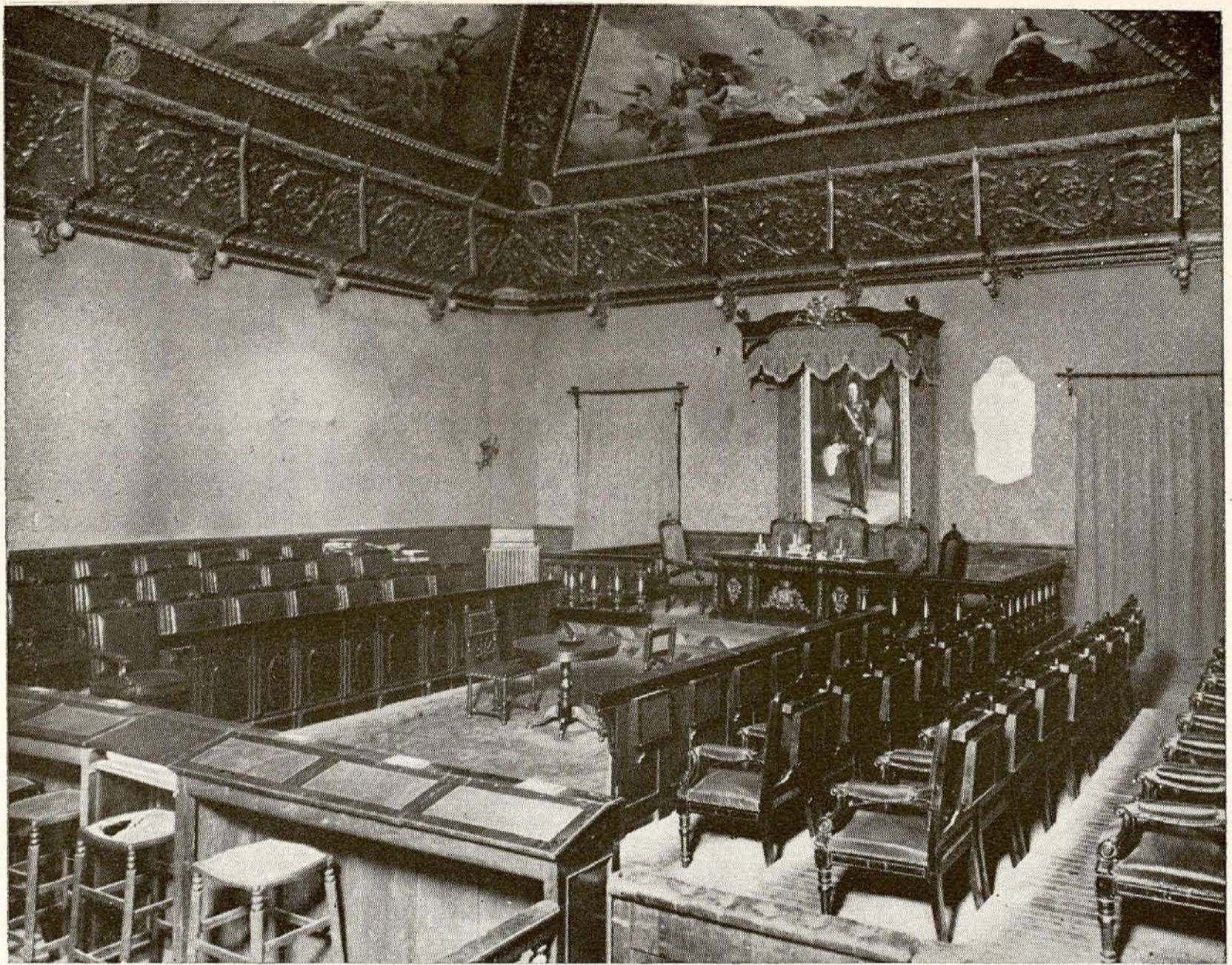
Casa Palacio.—Salón de sesiones.