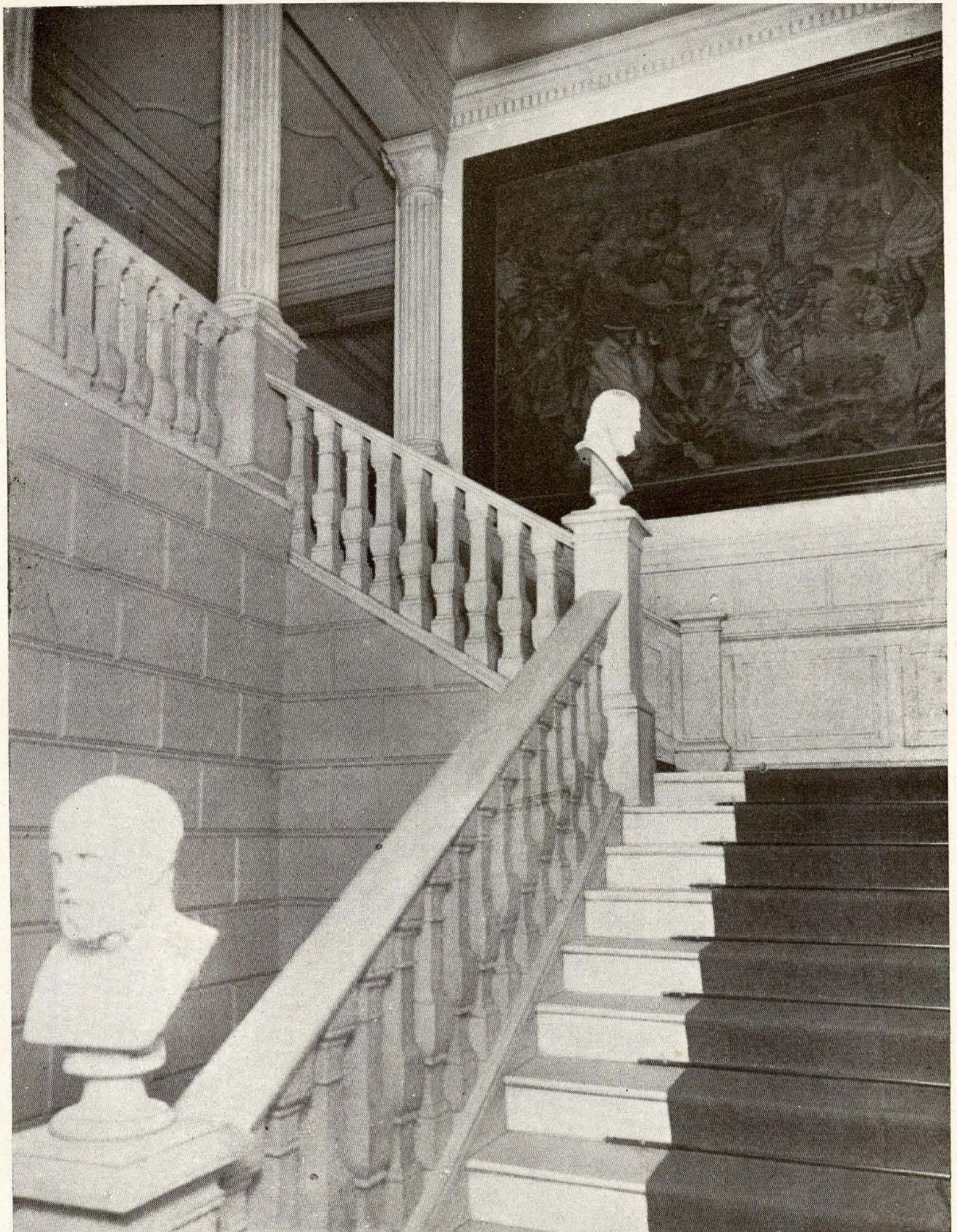
Casa Palacio.—Escalera principal.