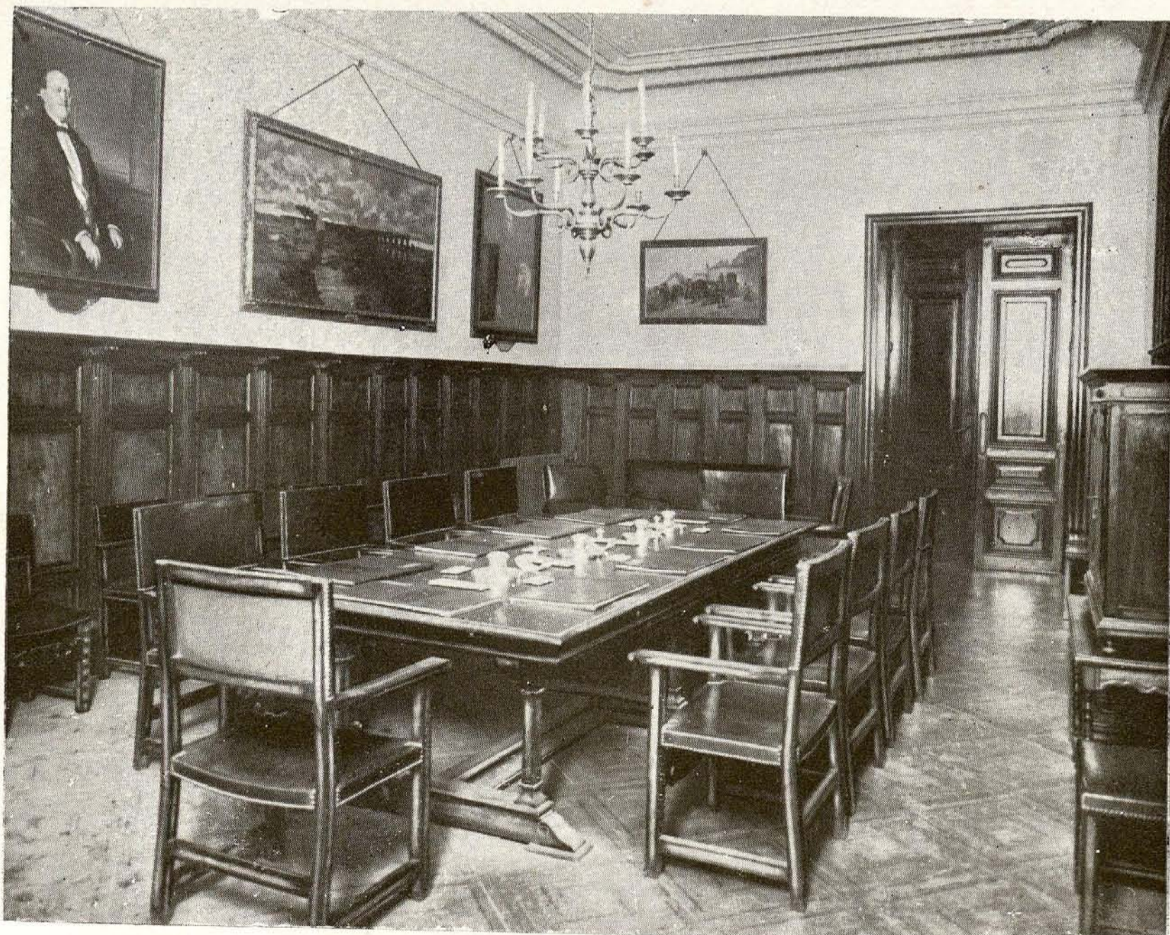
Casa Palacio. —Salón de comisiones.