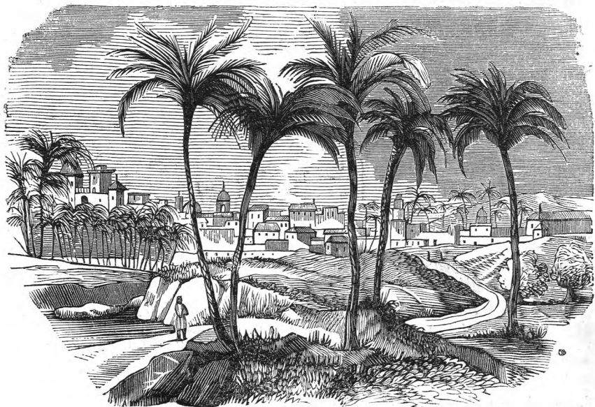
Vista de la villa de Elche.

ELCHE : Villa situada á cuatro leguas de Alicante, en un llano cercado de palmares y cruzado por las aguas de una rambla bastante profunda sobre la que tiene un puente. Su nombre y fundacion es de los árabes y el primero deriva de Illici; se conservan en esta villa muchas inscripciones y vesti-