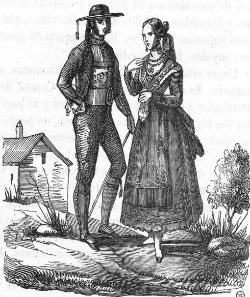
Trages de Salamanca.

vecinos y 960 habitantes. Pertenece á la diócesis y partido judicial de Ciudad-Rodrigo, de que dista cinco leguas. Tiene una parroquia y un estanco. En la quinta de 1844 entraron en suerte 64 jóvenes de 18 á 24 años. Pagó de contribucion 9,720 rs., y cosecha al año comun 3,500 fanegas de granos y legumbres, que con sus pastos y frutos menores producen 102,000 rs. No tiene industria.