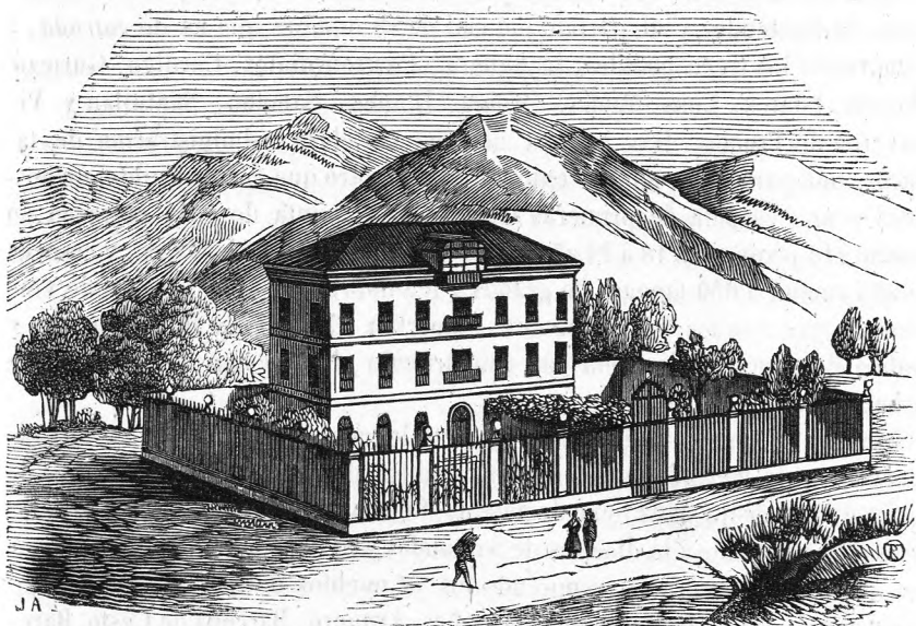
Baños de Ontaneda en el valle de Toranzo.

LAREDO: Villa situada á siete leguas de Santander en una eminencia rodeada de peñascos en la costa del Océano sobre la ria de Santoña, y en clima templado y saludable. Se cree que fué fundada esta villa por los godos, y habiéndose despoblado la mandó poblar de nuevo el rey don Alonso IX de Castilla por los años de 1174 y llegó á ser muy populosa. Tuvo parte esta villa en la célebre espedicion que al mando del almirante don Ramon Bonifaz y Camargo, derrotó á los argelinos que estaban en el embocadero de Sevilla, rompiendo la cadena del puente de barcas, lo que facilitó al santo rey don Fernando la conquista de la ciudad. Por real orden de 15 de enero de 1529, dada por la reina doña Juana y su hijo don Carlos, fué habilitado este puerto para el co-