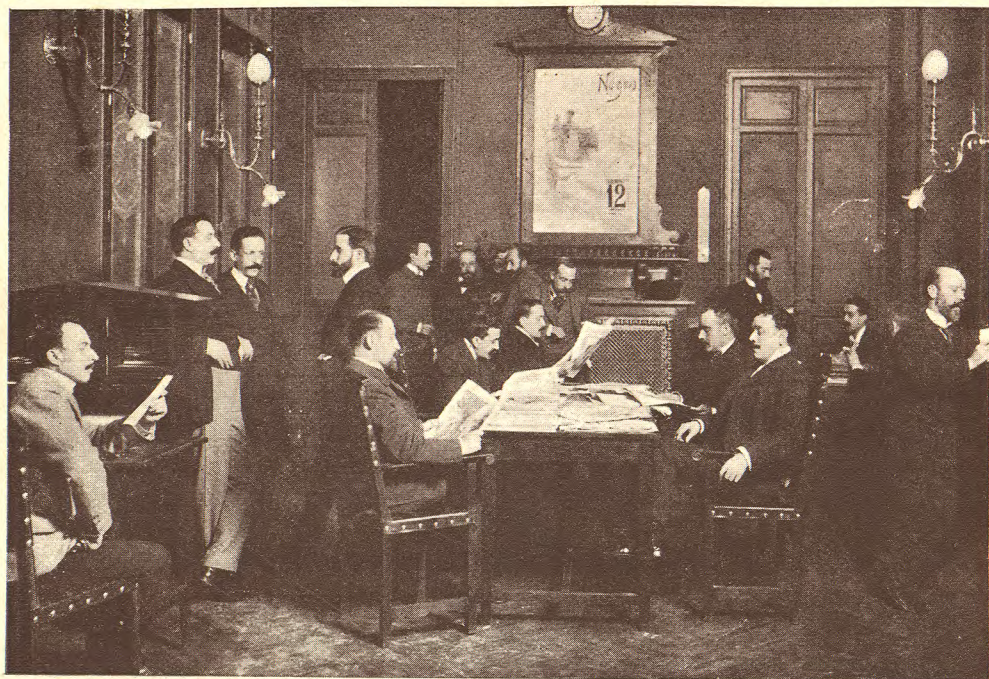
SALA DE REDACCIÓN

grabado; éste cuenta con los últimos adelantos en tan moderno arte, y la fotografía dispone de cuantos gabinetes, azoteas y máquinas exige la continua y compleja labor fotográfica de un