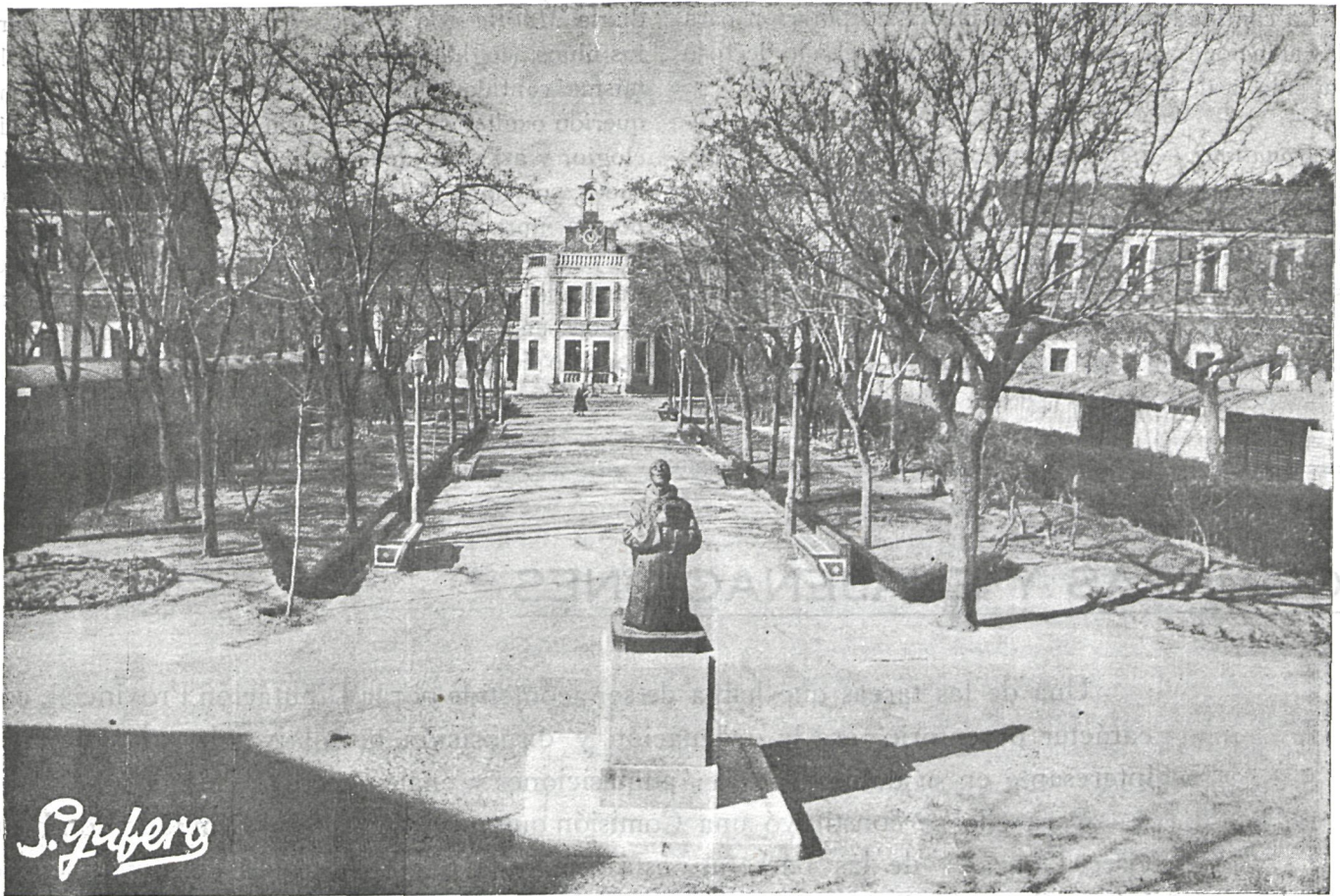
Hospital de San Juan de Dios

blema económico, toda vez que ninguno de ellos son naturales de esta provincia y además han sido internados por orden de la Dirección General de Sanidad o Jefaturas provinciales respectivas. Durante el año de 1949 se volvió a insistir ante dicha autoridad sanitaria, a fin de que se reintegre a la Diputación la cantidad que se le adeuda, que asciende a la suma de 278.350 pesetas.