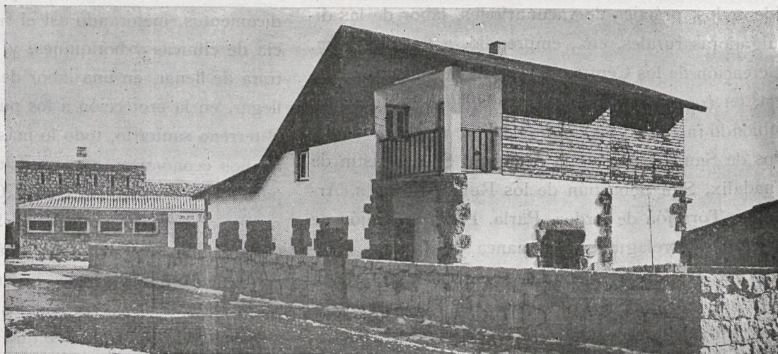
Casa del Médico en Hoyo de Manzanares

La Casa del Médico, en Hoyo de Manzanares, se ha construído por la iniciativa de la Corporación, eficazmente secundada por la Dirección General de Regiones Devastadas. Se remedia con estas construcciones la miseria de los hogares de los médicos. En la mayoría de los casos, la promiscuidad entre hogar y clínica es completa, inevitable; la vitrina, con el modesto instrumental, alterna con la mesa del comedor; las jeringuillas se hierven en la propia cocina de la casa y la llegada de un herido pone en conmoción la vivienda, en la que hay que trastocar muebles y movilizar palanganas. Este desagradable espectáculo, la triste insuficiencia de medios, donde terminan por naufragar tantas formaciones profesionales o van degenerando en continuo demérito, con la consiguiente pérdida de eficacia para el mejor servicio del vecindario, clamaba por una solución. Y esto es lo que ahora se emprende. La Diputación, de acuerdo con Regiones Devastadas y los Ayuntamientos, ha elaborado un plan. Regiones Devastadas aporta el 60 por 100 del valor total de la construcción; la Diputación contribuye con una subvención de 20.000 pesetas por cada nueva Casa, y el respectivo Municipio pone el resto, que viene a ser el 30 por 100 del coste de la obra. Esto ha comenzado ya a realizarse. El pueblo serrano y pintoresco de Hoyo de Manzanares tiene ya su Casa del