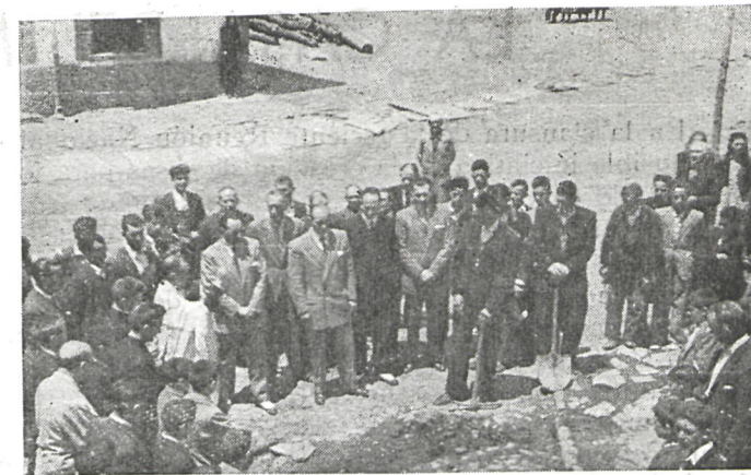
Inauguración de las obras de abastecimiento de agua en Montejo de la Sierra.

También la Diputación subvencionó en el año 1950, como detallamos en otro lugar de este número, la construcción de dos casas del médico en los pueblos de Hoyo de Manzanares y Olmeda de la Cebolla, y ha creado un premio anual a conceder a los Ayuntamientos que mejores tareas de higienización y cuidado desarrollen, con la particularidad de que el importe de dicho premio (50.000 pesetas) se hará efectivo con