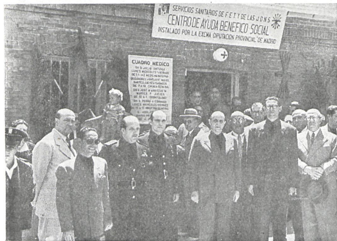
Fachada de la Clínica de Pozuelo de Alarcón el día de su inauguración.

A un Organismo provincial, como es la Diputación, le incumbe toda acción de impulso, prevención y amparo en relación con las pequeñas localidades de su ámbito jurisdiccional. La eficacia de su tarea ha de mostrarse, no sólo en la gran capital, donde a la par que el Ayuntamiento y los Organismos estatales sostendrá servicios benéficos, deberá montar su maquinaria administrativa y los servicios burocráticos necesarios para su funcionamiento, sino más especialmente en los apartados rincones, en los pueblos de menores recursos, en los montes y en los viveros, en el conjunto geográfico, en fin, que forma esa tan singular comarca que es la provincia de Madrid.