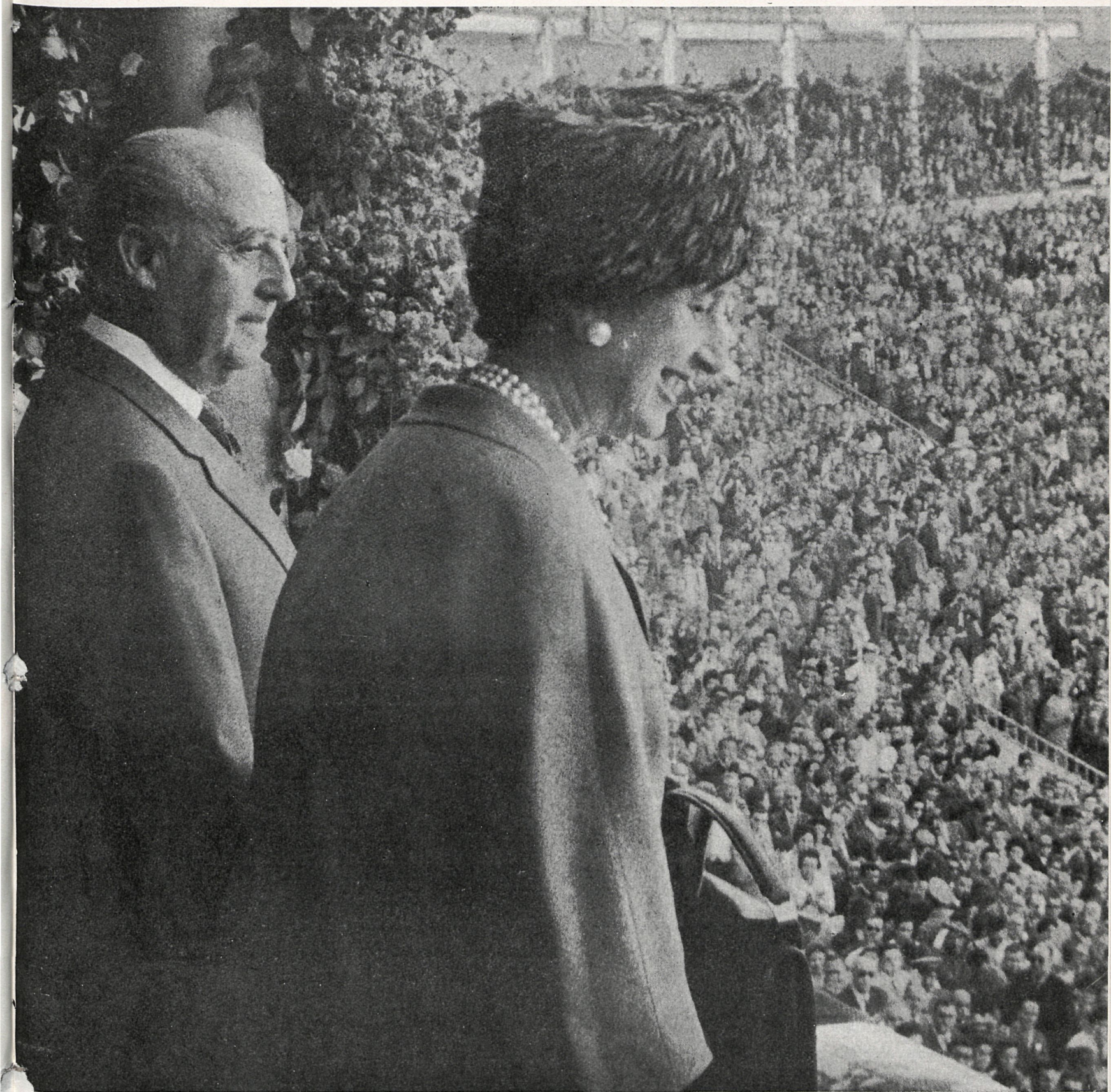
El Caudillo y su señora, D.ª Carmen Polo de Franco, corresponden a la ovación de un público que, constantemente, les repitió su admiración y respeto.