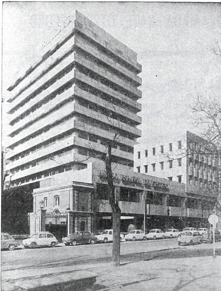
APARCAMIENTO EN EL PROPIO EDIFICIO