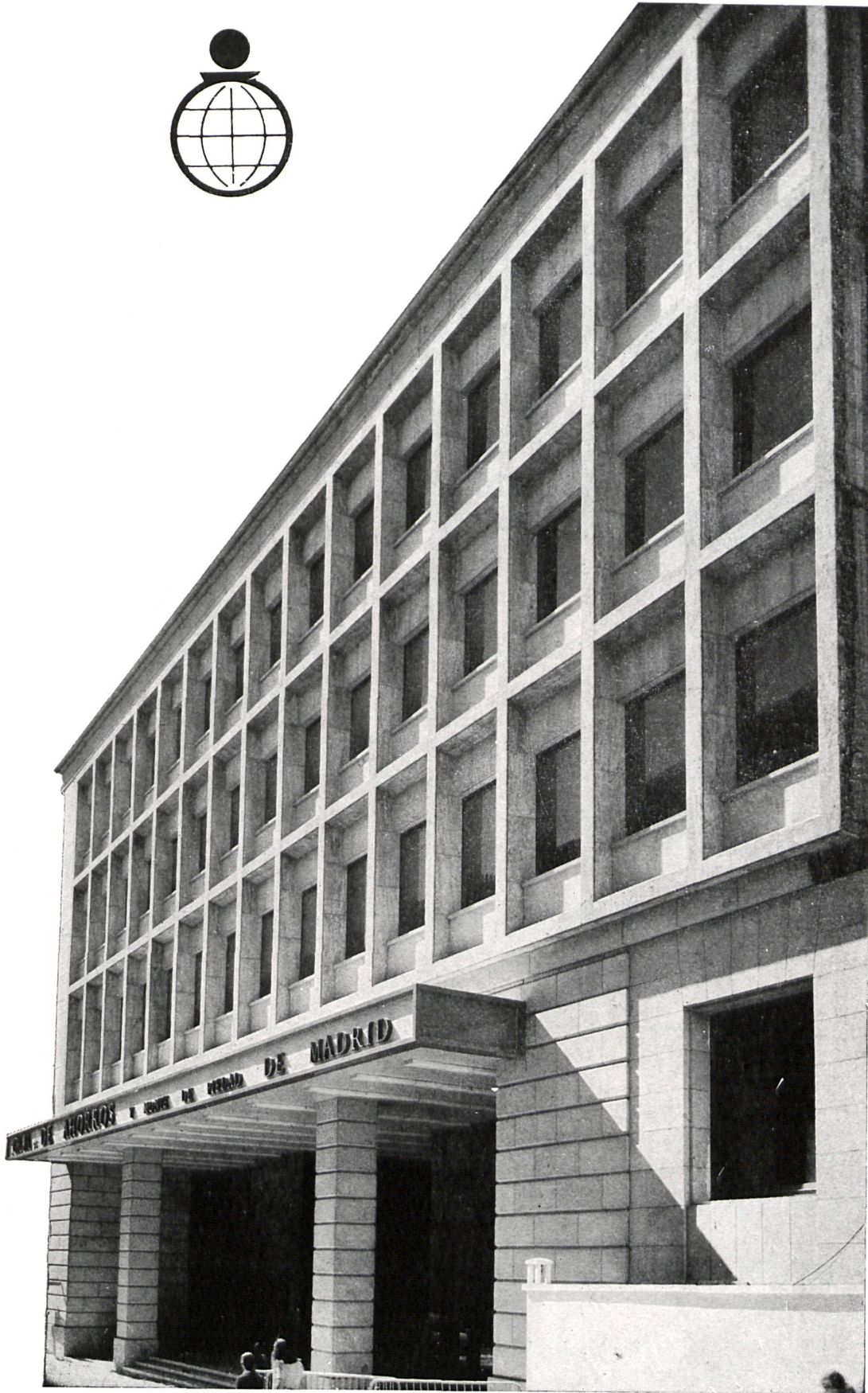
CENTRAL EN MADRID: PLAZA CELENQUE, 2