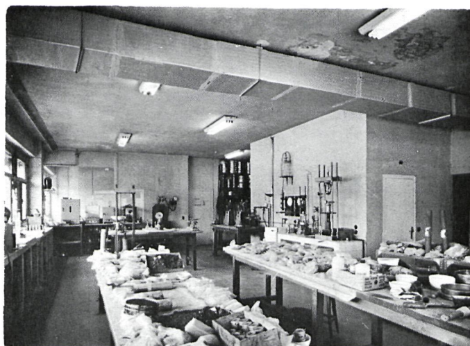
LABORATORIO DE MECANICA DEL SUELO