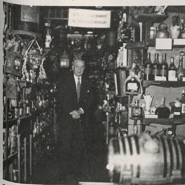
En el pasillo principal del Museo, apoyado siempre en su bastón

—El doctor Fleming. Estuvo dos veces en mi Museo.