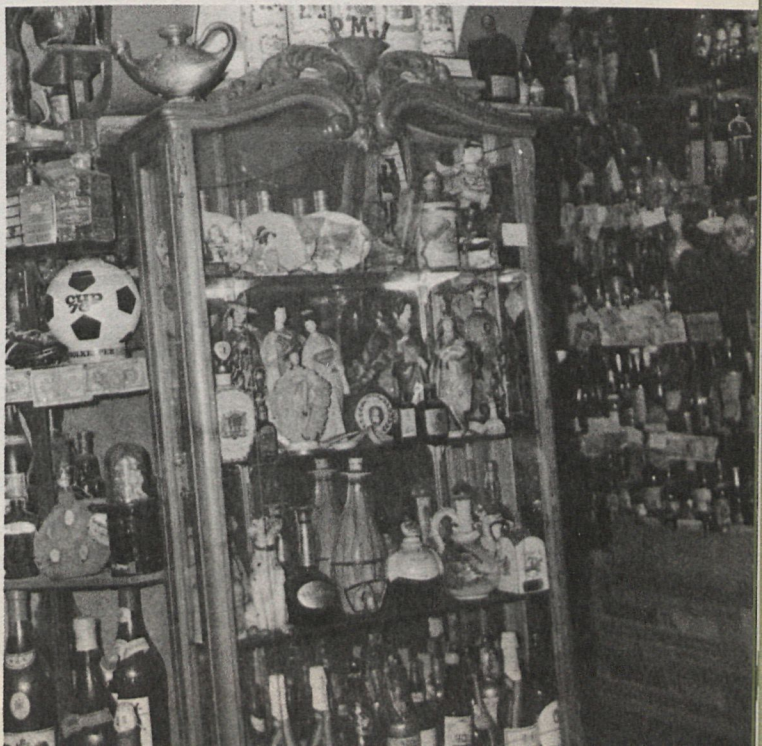
Detalle parcial de otro rincón del Museo Internacional de Bebidas de Perico Chicote

Isidoro PENIN CASTILLO (Fotos del autor)