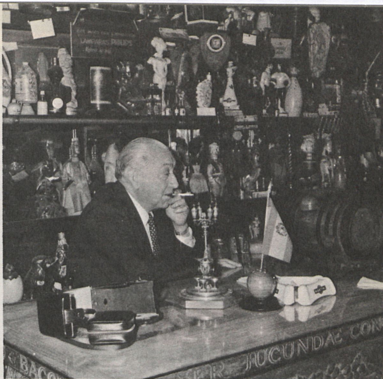
De vez en cuando (y no hace mucho tiempo de esto) gustaba de dar unas chupaditas a un cigarrillo

—Parece que está algo más animado, pero cualquier cosa le emociona en sobremanera. No le conviene