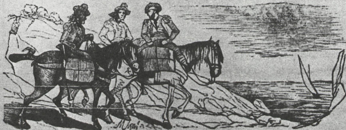
La venta de legumbres y vidriados de Alcorcón implicaba su transporte de unos lugares a otros. Grabado de una de las varias ediciones del libro «Los españoles pintados por sí mismos»

las, Campo Real, Carabaña, Casa de Uceda, Castilmimbre, Corpa, El Cubillo, Daganzo de Abajo, Fuentelahiguera, Fuentes, Gajanejos, Los Hueros, Loeches, Matarrubia, Mesones, Olmeda, Orusco, Pajares, Pezuela, Pozuelo del Rey, Puebla de los Valles, Redueña, Romancos, San Andrés del Rey, Santorcaz, Los Santos, Talamanca, Tielmes, Tomelloso, Tortuero, Torre-