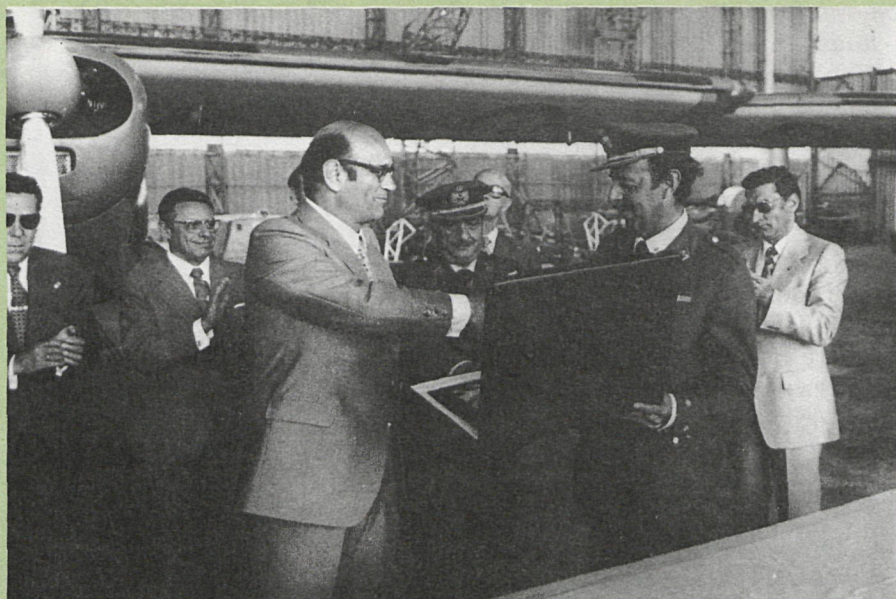
Momento de la entrega de la placa conmemorativa, por parte del presidente de la Diputación, al teniente coronel jefe del 404 Escuadrón