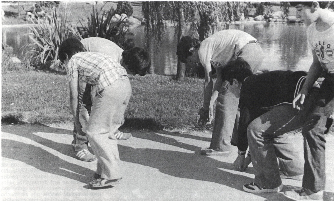
En Aluche: limpiar el parque. Acto de concienciación