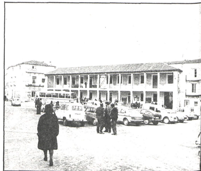
El Ayuntamiento de Villarejo ha exigido responsabilidades

Algún vecino, de los que participaron en la realización de las obras, ha comentado que las tuberías cayeron a las zanjas, arrastradas por una tormenta, y que tal como cayeron se procedió a las uniones y bridas sin reparar en la falta de capa de hormigón.