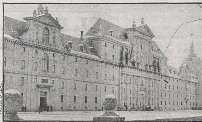
Chequeo a la enseñanza escurialense

Los concejales socialistas de Los Molinos han presentado una moción en la que urgen que comiencen los trámites para cambiar el actual plan de ordenación urbana. Han explicado que su modificación supondría el relanzamiento económico de la localidad, promocionando industrias no contaminantes y de artesanía, así como la construcción de viviendas sociales para trabajadores y la puesta en marcha del polígono agropecuario.