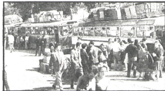
Das movilizaciones completamente distintas. El «no» al paro y el «sí» a las vacaciones. En realidad tienen un punto de conexión realmente triste, y es que sin trabajo no hay vacaciones de disfrute, hay vacaciones forzadas, sin alegría. El país se mueve en este binomio en el que, una vez más, «los de a pie» no son culpables