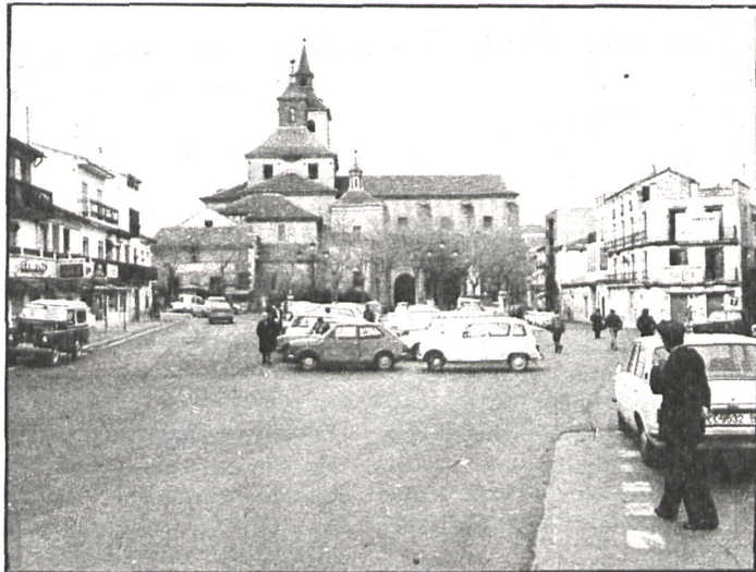
UCD de Arganda, contra la gestión del delegado de Tráfico

El Ayuntamiento argandense ha dictaminado que la venta ambulante deberá realizarse en el mismo lugar y día que hasta la fecha en la zona comercial del pueblo.