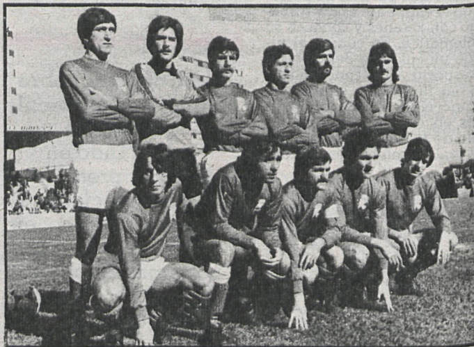
Peligro para el Alcalá. El domingo, en Ciudad Real, puede perder la cabeza

meterse en el grupo de gallitos gracias a su victoria sobre el Toscal. Ahora recibirá al Numancia, que podría ser víctima propiciatoria para los del Henares, pues no aparecen muy fuertes.