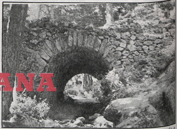
Puente romano de El Descalzo, primero de los que se han comenzado a restaurar

Pero adelantamos aquí algunos datos sobre este tramo de la calzada. Su recorrido comienza en el puerto de la