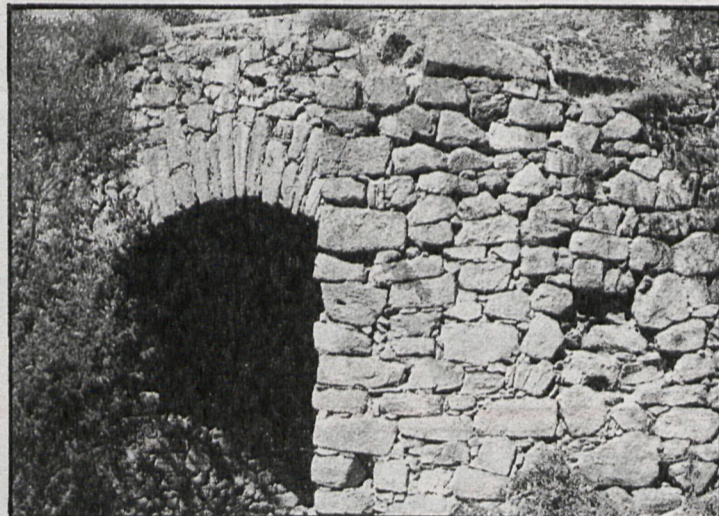
Primer plano del puente romano del Reajo o del Molino, sobre el río de La Venta, a su paso por Cercedilla

La Venta. La columna, fragmentada, de unos dos metros de altura, lleva una inscripción que se supone es de Vespasiano. Teniendo en cuenta que estas columnas solían llevar inscritas la fecha de construcción de la vía y recorrido desde su origen, y que Vespasiano, emperador romano, subió al trono el año 70, siglo I d. de C., podemos deducir la fecha de esta calzada.