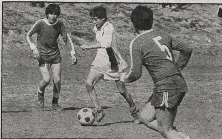
La reploblación forestal, entre las preocupaciones de Villamanta

— El uso de lentes, a pesar de no estar prohibido por la