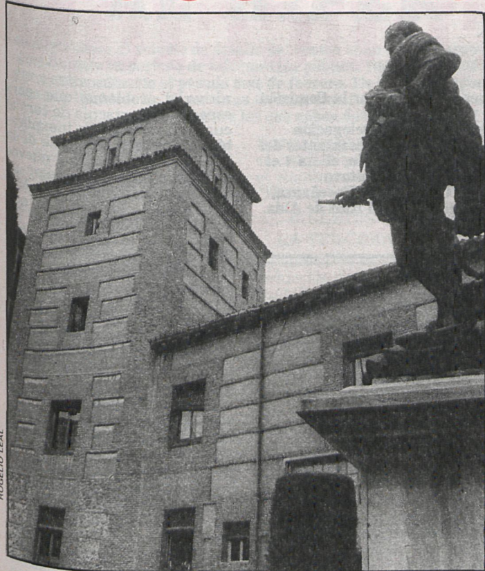
La Casa de la Villa se descentraliza

Hace unas semanas informábamos en CISNEROS del decreto aprobado por el pleno del Ayuntamiento de Madrid por el que se concedían a las juntas municipales de distrito atribuciones que hasta ahora les estaban vedadas