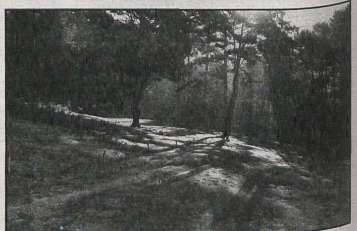
La repoblación forestal, entre las preocupaciones de Villamanta

En el pleno celebrado el pasado viernes se acordaron, entre otros puntos, dos de tipos fiscal. De tal forma se aprobó el pago de 300 pesetas por perpetuidad de sepulturas como propiedad del suelo, corriendo los gastos de construcción de las mismas por cuenta del propietario.