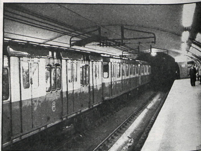
Una vez más la conflictividad llega al Metro. Madrid pudo quedar colapsado por la paralización del servicio, pero a última hora la huelga quedó desconvocada

El camino recorrido y la lucha mantenida por los trabajadores ha sido excesivamente duro. Se ha dictado un decreto-ley sobre mantenimiento de servicios mínimos y, a pesar de todo, se ha ido a la huelga total; ello motivó unas declaraciones del ministro de Trabajo en Televisión y la afirmación —casi amenaza— del alcalde de Ma-