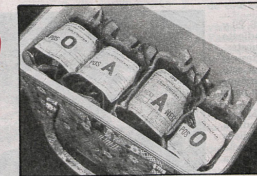
Donar sangre, un deber cívico que a todos compete y que puede salvar nuestra propia vida. No duele, no perjudica y sólo beneficia. Madrid necesita 4.000 litros mensuales de un oro rojo que salva vidas. Las ATS, segundos antes de la donación, investigan el número de hematíes que el donante posee

La donación ha de entenderse como un deber ciudadano que a todos nos obliga