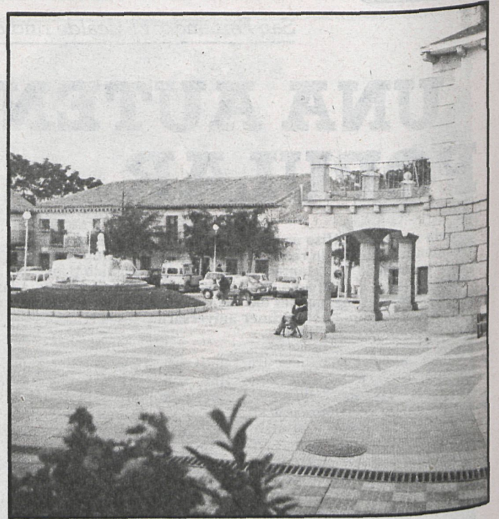
Galapagar: más que discrepancias entre los ediles

Y añade: «Hemos votado en contra del presupuesto de este año. La razón es muy simple: No pode-