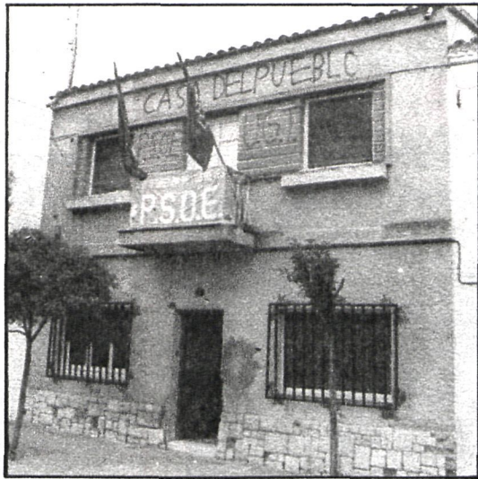
Casa del Pueblo: ya funciona

Dos puntos de un total de 13 que componían el orden del día en la sesión ordinaria celebrada por el Ayuntamiento de Alcobendas el día 18 del presente mes encontraron alguna dificultad para su aprobación.