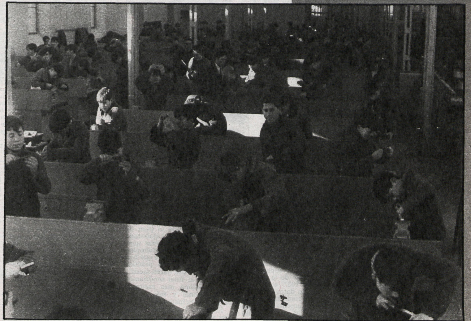
La formación profesional, un campo apenas explotado en los pueblos de Madrid

partidos. Las cifras más abultadas son, lógicamente, en los municipios de Alcalá y Coslada, seguidos muy de lejos por Mejorada del Campo.