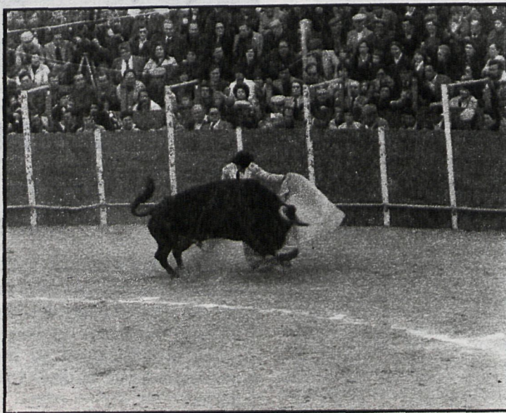
Los Dominguites se llevaron al agua el gato taurino de Colmenar

La regentarán durante un año y exclusivamente para organizar los festejos de las fiestas patronales