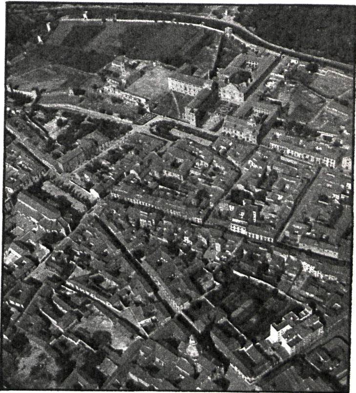
La nueva cárcel alcalaína no se hará en el casco de la ciudad