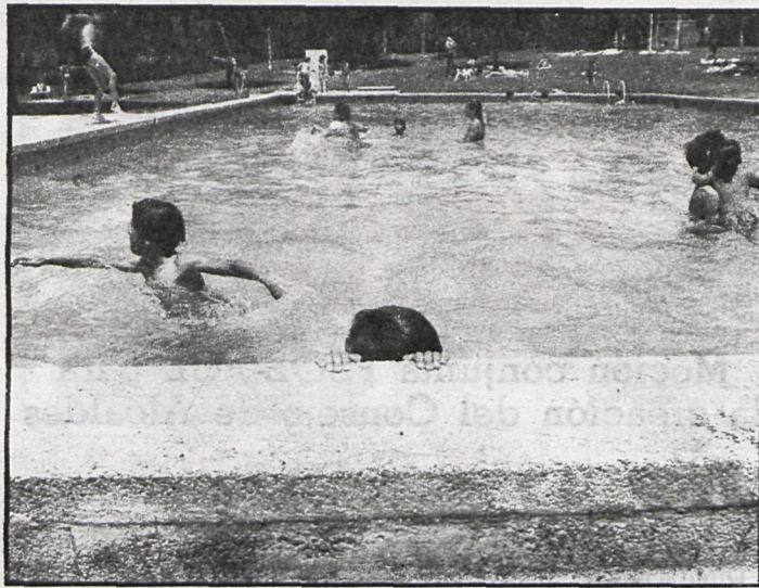
La natación, plato fuerte de las campañas durante el verano

Alcobendas: Gracias a las campañas organizadas por el Ayuntamiento