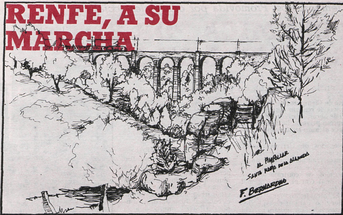
Santa María de la Alameda, entre los pueblos perjudicados por la nueva estructuración ferroviaria

no cubre las necesidades reales de los pueblos de la sierra. Se sospecha que la decisión ejecutiva tiene móviles económicos, es decir, que si las unidades no van llenas, la operación no es comercial. Y los viajeros de los pueblos intermedios, con menos trenes. No obstante, parece que desde que publicamos la primera denuncia en CISNEROS se han corregido algo las medidas. Según los cálculos de Renfe, en 1990 cercanías tendrá 500.000 viajeros diarios.