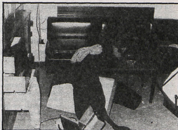
Los robos en domicilios particulares, fiebre del verano madrileño