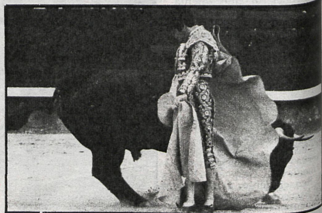
El Inclusero en un magnífico quite por chicuelinas