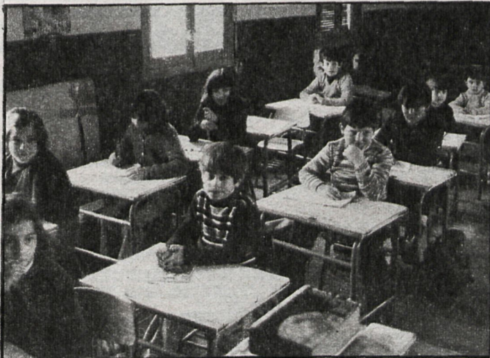
Escolarización: el curso puede presentarse conflictivo

Hace unos quince días, el Ministerio de Educación ha pedido al Ayuntamiento la cesión