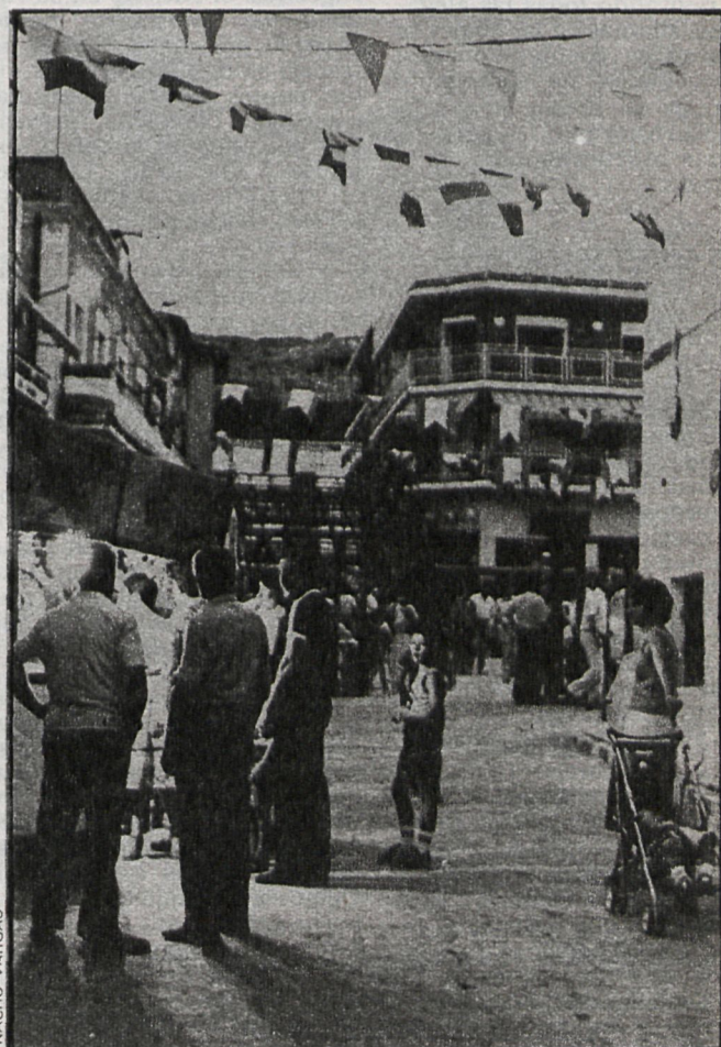
Tielmes, como gran número de pueblos de la provincia durante estas fechas, luce engalanado en plenas fiestas, sin que falten los puestos feriales

Pudimos oír también el chotis de concierto del maestro López de Saa, sobre un poema de Rosario Moncada, «La ribera de Curtidores». La presencia del chotis en el recital parece ser que fue muy oportuna, ya que, según comentaristas, fue en Aranjuez donde por vez primera se bailó el chotis. Parece ser que en la primavera de 1850, y durante una fiesta en el Palacio Real, Isabel II bailó una pieza que introducía en el país este baile. Era obra de un escocés, con la dedicatoria siguiente: «A la reina de España. Dance scottish.»