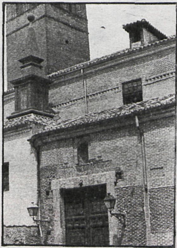
San Pedro el viejo

La obra de mayor envergadura de Europa occidental en materia de restauración en estos momentos es la que se realiza en el antiguo Hospital Provincial, en opinión del director del Patrimonio Artístico. Unos mil millones de pesetas se van a invertir en los próximos diez años en este viejo caserón, destinado a albergar, entre otros museos, el del cine, la ampliación necesaria del Prado, el Ballet Nacional, la Filmoteca Nacional, etc. Un popurrí de museos, según una sugerencia del ministro de Cultura, Ricar-