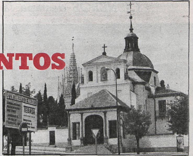
Capilla de San Isidro

La labor de restauración y conservación de los monumentos corresponde realizarla al propietario de turno. En caso de que éste no lo haga, el Estado, mediante la declaración de monumento nacional, puede intervenir para evitar la pérdida de un tesoro irrecuperable e irrepetible. Este es el caso de la iglesia de San Cayetano, que se ha tenido que declarar monumento histórico-artístico un poco por las bravas, porque si no, la Dirección del Patrimonio Artístico no podía intervenir. Así, se ha salvado, o está en vías de salvación, lo que parecía condenado a desaparecer por la tozudez de algún desaprensivo.