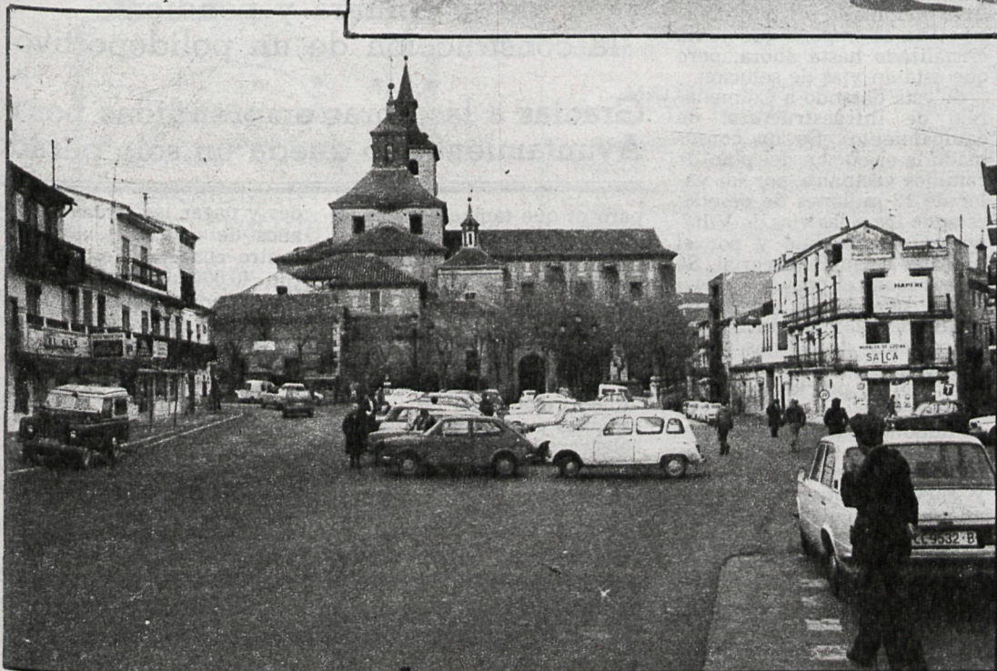
Las plazas escolares en Arganda, claramente insuficientes

San Martín de la Vega: Después de treinta y siete años de espera