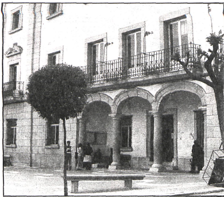
Colmenar: Cultura para todos

En Colmenar Viejo, primeras jornadas en colaboración con la Diputación