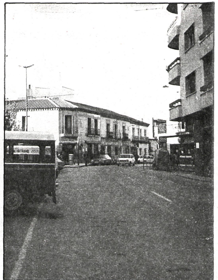
Las calles de Alcobendas verán reforzado su firme

En cuanto al campo cultural, poco hay en estos momentos reseñable, ya que el período vacacional rompe con cualquier actividad. Simplemente apuntar que en el orden deportivo continúan desarrollándose los cursillos de natación que empezaron en el mes de julio.