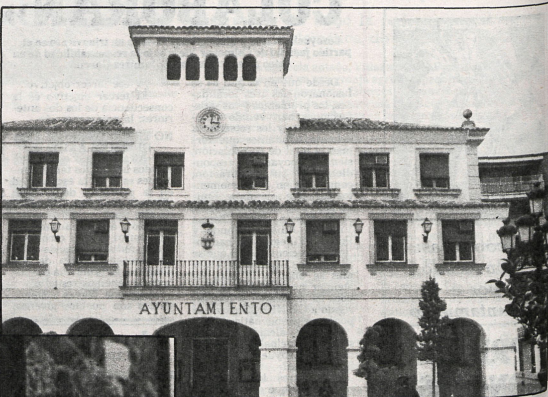
El Ayuntamiento va a recabar la ayuda económica de los organismos estatales para mantener la Universidad