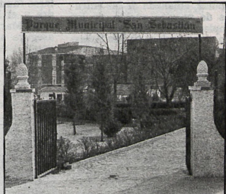
Todos los aspectos relacionados con el urbanismo en San Sebastián se verán directa o indirectamente afectados por la remodelación

Con relación a la situación escolar, y aunque San Sebastián no sea una de las poblaciones más conflictivas, se encuen-