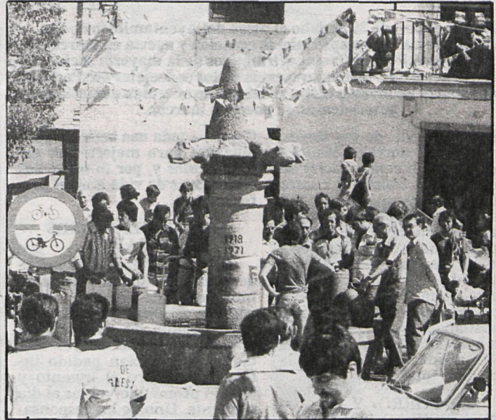
La próxima finalización de las obras de traída de aguas acabará con los problemas de abastecimiento en el pueblo

Lozoyuela, Navas y Sieteiglesias son pueblos jóvenes,