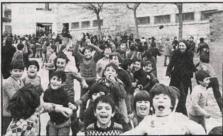
Mientras las clases se desarrollan normalmente en numerosos colegios, los niños de Colmenar se ven afectados por la carencia de profesorado

Colmenar Viejo: A pesar de lo avanzado del curso