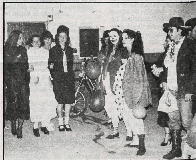
Humor, como puede verse, no faltó