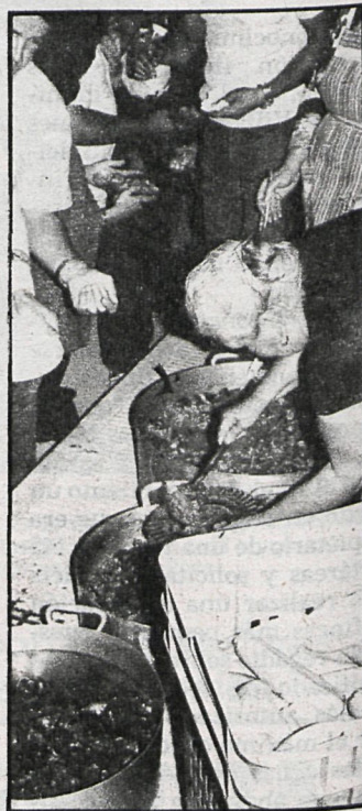
La típica caldereta hizo las delicias de todo el pueblo

Pero en Lozoyuela no sólo son los ancianos quienes encuentran cariño y ánimo. También los jóvenes tienen su participación, y todos a coro, como si de una única