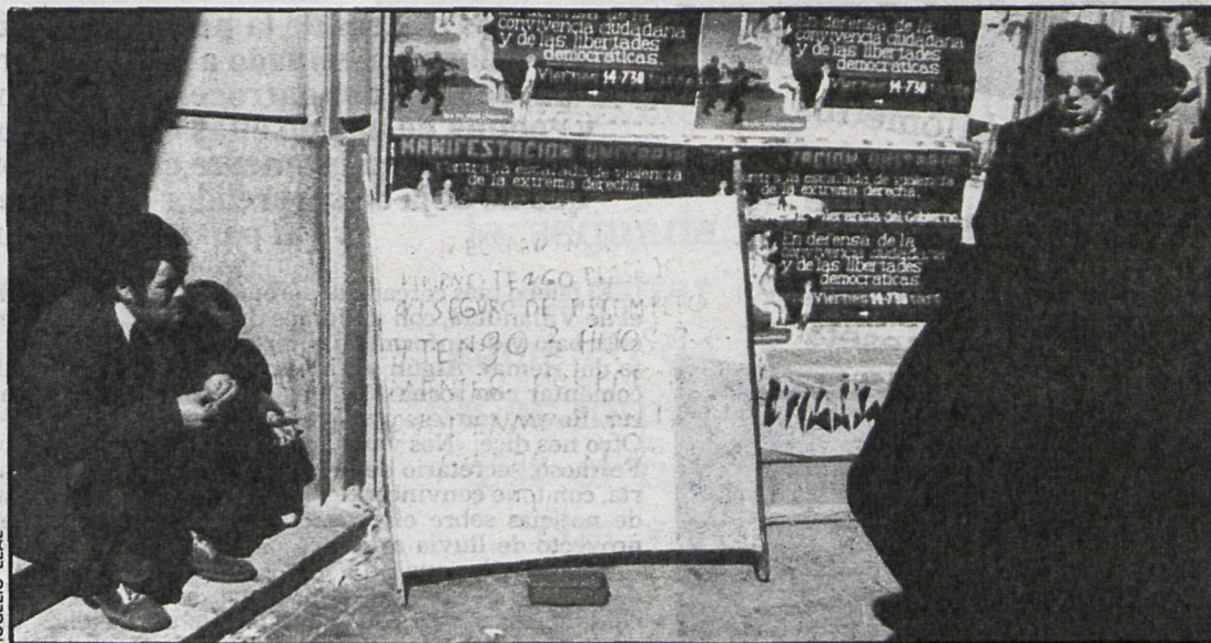
«No tengo trabajo ni seguro de desempleo»... la triste letra de una canción que cada vez cantan más voces por las calles de Madrid

Las previsiones respecto a ventas, en términos reales, deberán aumentar teniendo en cuenta los resultados obtenidos. Son pesimistas las previsiones respecto a la inversión en este sector.