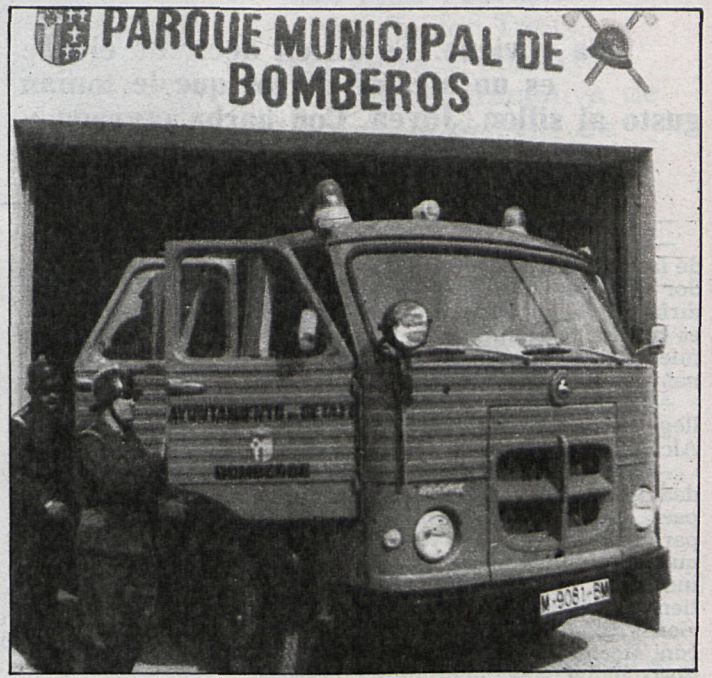
El capítulo de personal es uno de los más cuantiosos del presupuesto anual del Ayuntamiento

El año pasado el Ayuntamiento se gastó 50 millones de pesetas en comprar solares, que se ceden gratuitamente para escuelas, obras sociales, centros sanitarios