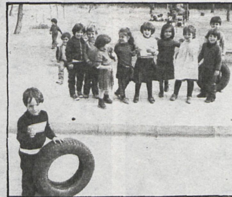
física en todos los colegios estatales de EGB y hemos creado 15 escuelas deportivas, donde participan más de cuatro mil chavales. Esto es un salto importante. Además se han construido instalaciones deportivas, polideportivo, campo de fútbol y otros.

—¿Y qué es Getafe, señor alcalde? —Un producto típico del crecimiento de las grandes ciudades, que son alrededor de ellas cinturones en las que yo diría que la problemática fundamental es la falta de planificación y de equipamientos, el hacinamiento de las personas y la falta de infraestructura. —¿Y cómo se encontró Getafe cuando llegó desde las urnas electorales a esta Alcaldía? —Con problemas urbanísticos de ciudad mal hecha, que se había pensado para que la gente durmiera, pero no para que sirviera para vivir, a pesar de que no es una ciudad dormitorio, sino industrial. Y esa es la diferencia que tiene con otros lugares, con otras poblaciones como Leganés, Móstoles, Alcorcón, etcétera. Getafe es una ciudad industrial que tiene importantes fábricas y empresas y con una importante parte de los ciudadanos que viven y trabajan aquí. Creo que ésta es una característica que la define bien.