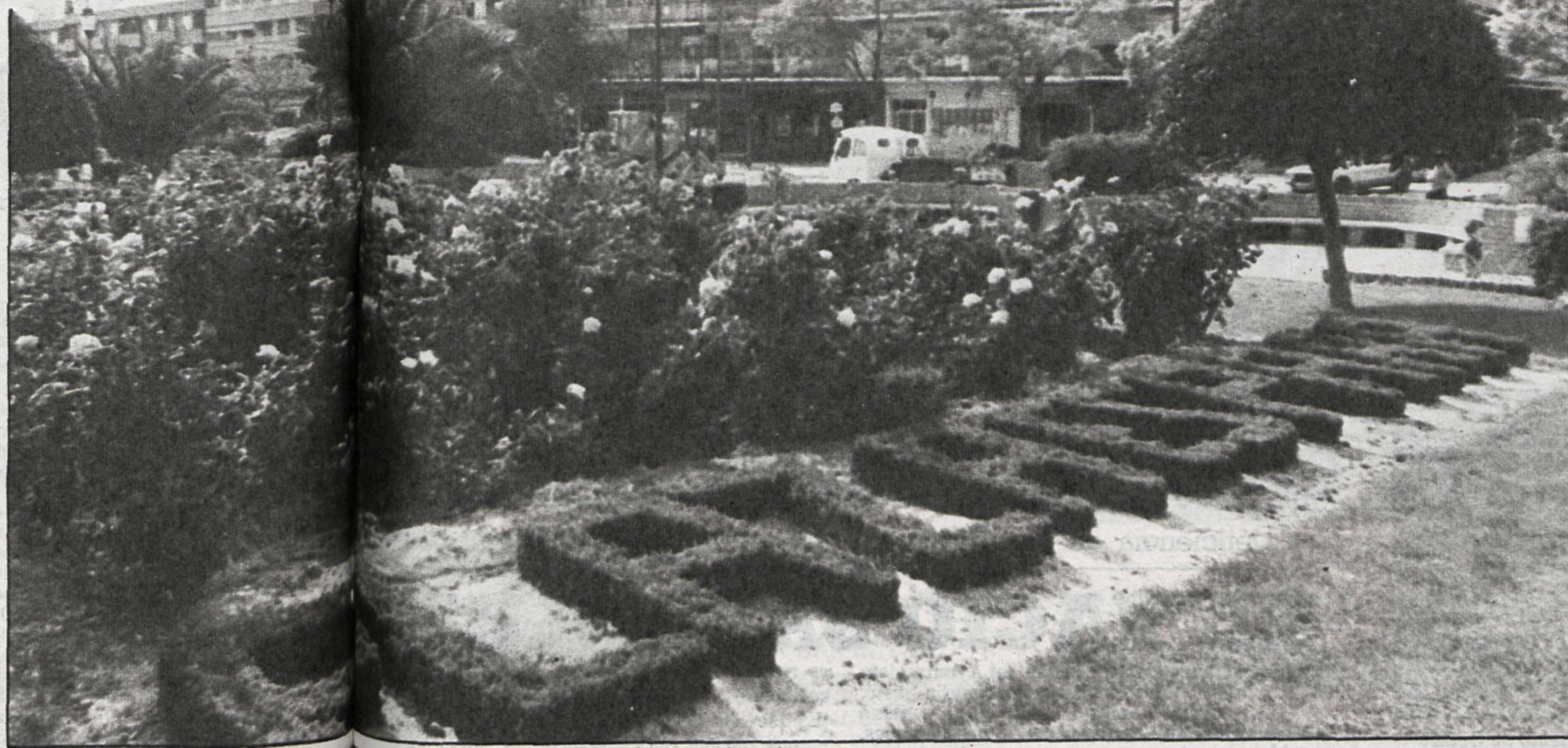
Plaza de España de Getafe

De cara al futuro, la ciudad demanda un crecimiento moderado y diferente. Ahí está la aprobación del Plan Provincial del Sector Tres, que se va a construir a través de la iniciativa de los cooperativistas de viviendas unifamiliares