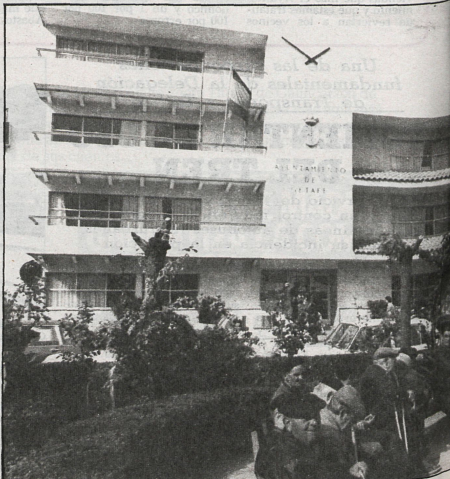
Ayuntamiento de Getafe

«Este es pueblo de gente luchadora, conflictivo, pero que participa, colabora y arrima el hombro. Da gusto luchar por él»