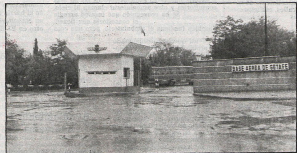
Base aérea de Getafe, uno de los símbolos conocidos de la ciudad cercana a Madrid

hecho en Leganés, porque es donde les daban los terrenos, naturalmente. Esto entiendo que es una falta o un fallo grave. A otros temas tampoco se atrevió a enfrentarse, quizá porque se consideraba que era una Corporación en interinidad. Pero como contrapartida, entiendo debo decir lo que no se ha hecho mal. —Por ejemplo... —Algo que se hizo y que es importante para Getafe es el tema del Plan General. En estos momentos Getafe y otro municipio de la provincia son los dos únicos pueblos que tenemos un Plan General adoptado a la ley del Suelo de 1975. Que no coincidimos en algunas cosas que marca ese Plan, especialmente en la zona de Perales, no quiere decir que el Plan, en líneas generales, no tenga aspectos muy positivos, como son las cesiones, que son altas. Ese fue un acierto de la anterior Corporación y ahora lo estamos viendo en el Sector Tres, donde van las cooperativas, y que nos va a servir para recuperarnos por medio de esas cesiones de equipamiento, en parte, de lo que le faltaba a Getafe. Pero, sin embargo, no se atrevió a entrar en el Plan Especial de la Reforma Interior (PERI), porque donde estaba el gran problema era en el casco urbano. El PERI está en estos momentos en periodo de información pública. Y ahí es donde está el auténtico problema getafense.