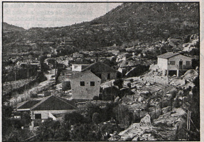
La Corporación quiere que el crecimiento de La Cabrera sea racional

ble del área de urbanismo. En este momento —prosigue la nota— se han iniciado cuatro expedientes sancionadores por infracción urbanística, de los que dos están originados por delitos urbanísticos de carácter grave, pudiendo resultar de los mismos incluso la demolición de la obra originante del hecho.»