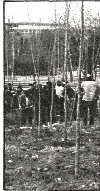
Los árboles han sido cedidos por la Delegación Provincial del Ministerio de Agricultura

Finalizaremos la información de este municipio con una noticia artística, ya que la iglesia de Santiago Apóstol ha sido declarada monumento histórico-artístico. La notificación de esta resolución llegó al Ayuntamiento la pasada semana.