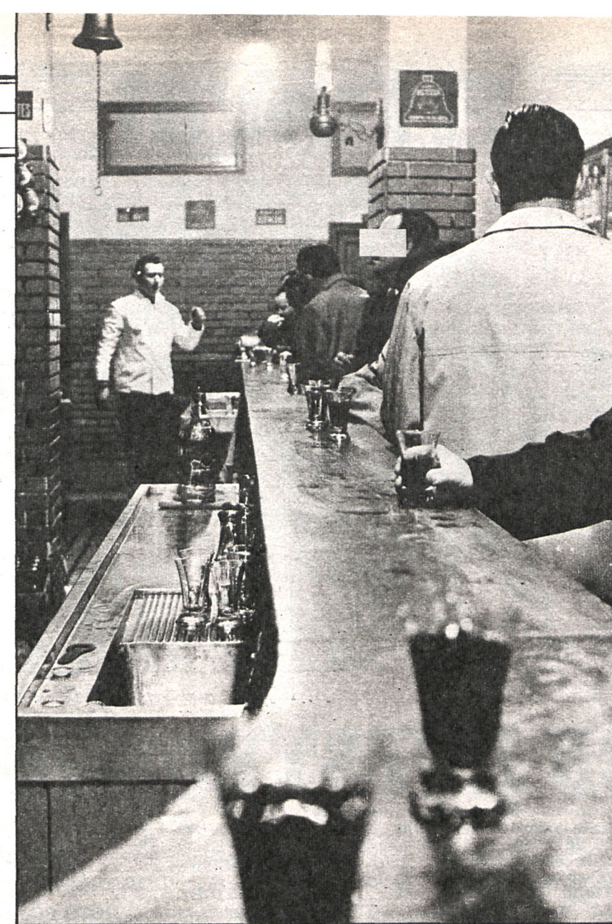
El bar es lugar de encuentro y amistad en toda España. Las localidades de Móstoles, Leganés, Alcalá y Arganda baten récords en esto del «tapeo»

narca decidió levantar otro palacio en 1561, encargando proyectos a Juan Bautista de Toledo y Herrera, así como los de las Casas de Oficios que concluiría Gómez de Mora. Después los palacios y palacetes se fueron completando, modificando y transformando con la llegada de la dinastía borbónica, construyéndose otros palacetes, como la Casa del Labrador, fuentes, jardines y monumentos. La Corte pasaba sus mejores temporadas entre San Lorenzo del Escorial y Aranjuez. Hacia 1800 la villa contaba con 6.000 habitantes, que cuando llegaba la Corte se convertían en 20.000.