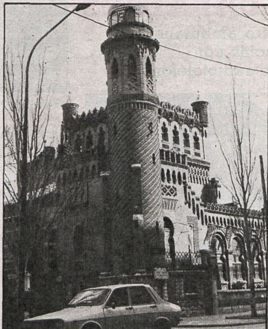
El palacete de Laredo, «reconquistado» por el Ayuntamiento, inaugurando en dicho y bello edificio un interesante museo de la ciudad

Si hay interés en la clase llana, en el ciudadano de a pie por la cultura. Raro es no contemplar a grupos de personas curioseando títulos de publicaciones o leyendo titulares, acaso porque comprar todo «lo que se ve» no está a su alcance