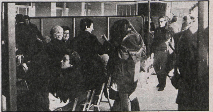
Saturación en los escasos consultorios y ambulatorios que existen en la ciudad

dencia sanitaria (hospital), que después de muchos años de lucha ya tiene luz verde. También, la esperanza de que se construya un centro comarcal de la Seguridad Social, a nivel de asistencia primaria. Para ello, el Ayunta-