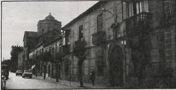
Edificio adquirido por el Ayuntamiento para instalar en él el centro de salud municipal. Una gran conquista en la sanidad, por la que se ha luchado durante mucho tiempo

—El servicio especial de urgencias, a todas luces insuficiente. Las cuatro ambulancias para el censo mencionado de Alcalá y 10 pueblos de la comarca, la insuficiencia no es su nombre si tenemos en cuenta que mientras no dispongamos de plazas de