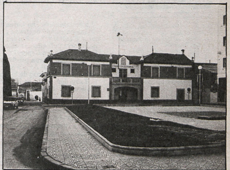
La Casa Consistorial de Mejorada del Campo se ha quedado pequeña, y los 25 millones ofertados permitirían edificar unas nuevas instalaciones