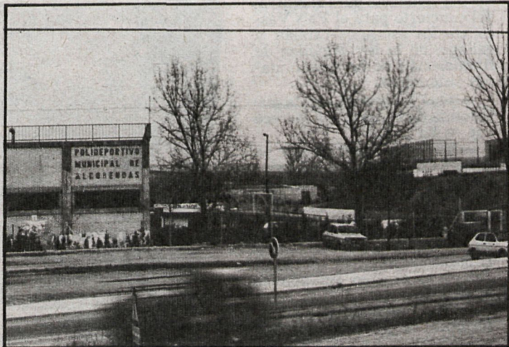
El Polideportivo Municipal juega un importante papel en el desarrollo de la política deportiva de Alcobendas

Ante estos hechos —que ya ocurrieron en otras ocasiones— las fuerzas políticas y sociales del pueblo han emitido un comunicado en el que consideran que los sucesos «ponen en gravísimo peligro la convivencia pacífica en nuestro pueblo». Al mismo tiempo acuerdan dirigirse al Ayuntamiento para que reclame la intervención del Gobierno Civil, y manifiestan su «más enérgica protesta por la conducta incivil y absurda de estos individuos, que públicamente condenamos con este documento».