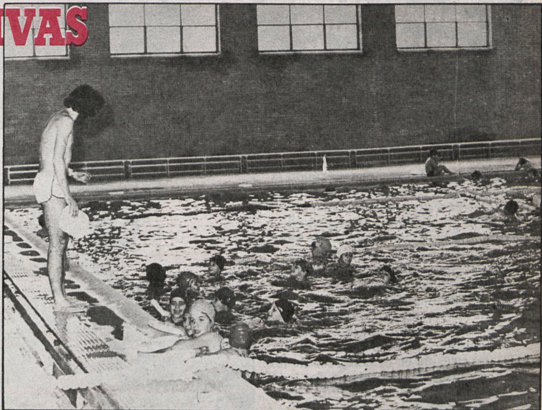
El monitor se dirige a los niños de Alcobendas, durante una de las clases de natación, dentro de la campaña que se está realizando con alumnos de numerosos colegios

El desarrollo de todas estas actividades se llevan a cabo tanto en las instalaciones polideportivas del Ayuntamiento como en la de los distintos co-