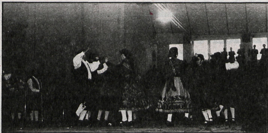
El conjunto folklórico de Villanueva de la Vera, durante su actuación

■ En la segunda quincena del presente mes comenzarán las obras de pavimentación de varias de las calles de la localidad de Batres.