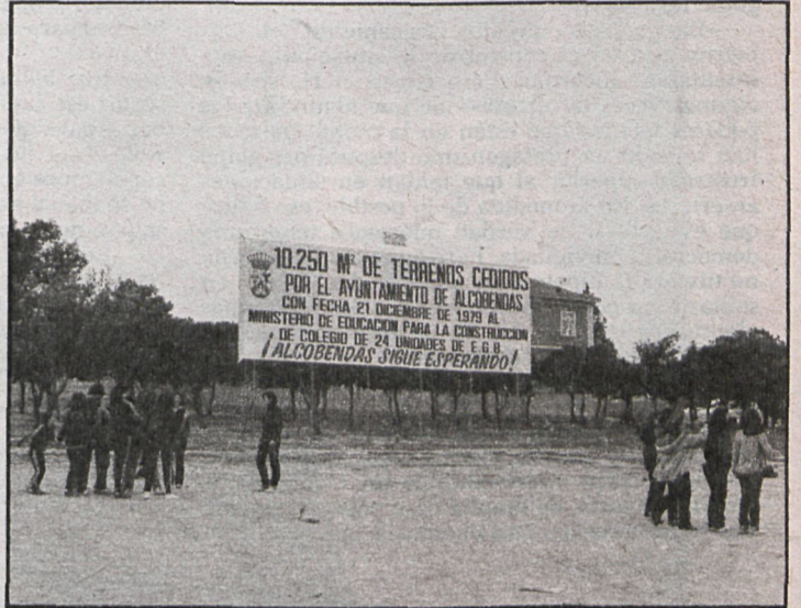
Los solares están a punto, pero el Ministerio no ha procedido a la construcción de los centros

En total, de cara al curso 1981-82, el Ayuntamiento ha cedido alrededor de 12.000 metros cuadrados, en los que el Ministerio de Educación y Ciencia se ha comprometido a construir un total de 40 unidades de EGB, sin que hasta ahora se hayan iniciado las obras.