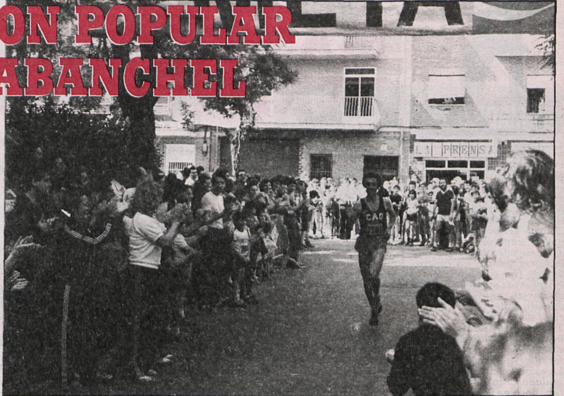
La participación en la carrera se espera sea masiva

Esta peña cultural nació en junio de 1979 como peña deportiva para animar al equipo de fútbol del barrio, pero fue ampliando su miras dada la buena acogida de todas sus actividades. Entre los actos que ha organizado esta peña destacan la organización de la calbagata de Reyes de 1981, la Vuelta Ciclista a los Caraban-