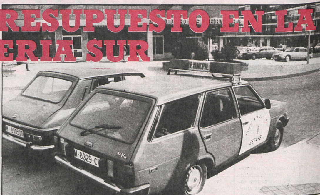
El aumento de los presupuestos tiene como objetivo una mejora en los servicios. Servicios que, en el caso de la Policía Municipal, se han incrementado sensiblemente

Ningún ayuntamiento de la periferia sur ha aprobado aún los presupuestos para 1981 en pleno municipal. Sin embargo, CISNEROS ha venido realizando una labor de seguimiento, cuyos primeros resultados ofrecemos aquí. Se trata de datos obtenidos en la ronda de entrevistas que hemos realizado a todos y cada uno de los alcaldes de los municipios de esta zona de la provincia de Madrid