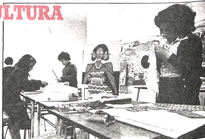
En la Escuela Municipal de Pintura de Arganda reciben enseñanza numerosos jóvenes de la localidad

se celebran distintas conferencias y coloquios. A partir de entonces, esta sala ofrece un apretado programa de muestras artísticas, que en la actualidad se extiende hasta el próximo mes de octubre. Esta sala, que tiene un carácter totalmente gratuito,