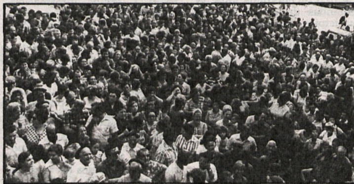
La manifestación, multitudinaria, estuvo presidida por un ambiente festivo en todo momento

A las once de la mañana del domingo pasado, día 7, tres columnas de manifestantes par-