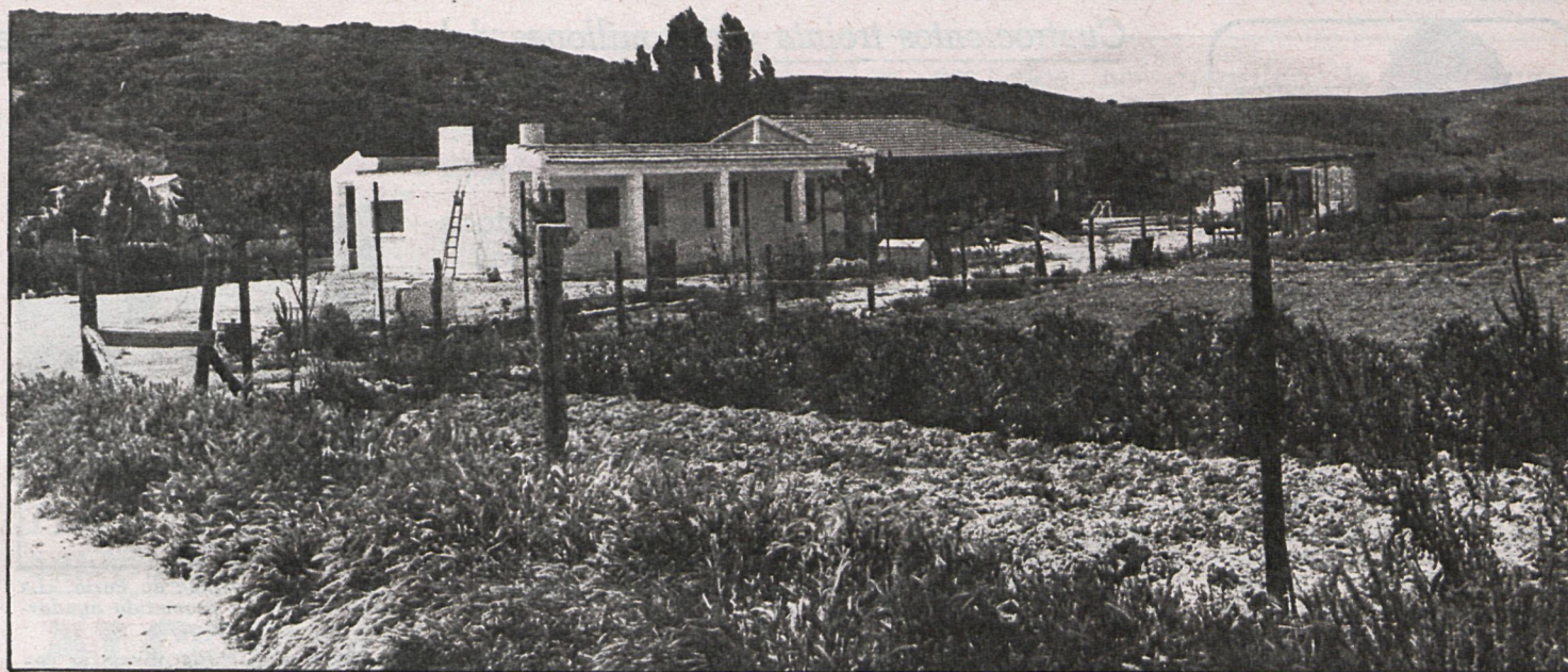
El tipo de construcción es el mismo en la mayoría de las urbanizaciones ilegales

Los Ayuntamientos de Madrid y Burjasot (Valencia) realizan un intercambio de 60 niños los días 26, 27 y 28 de junio. Este es el inicio de una serie de intercambios que se van a llevar a cabo con otros ayuntamientos. Los niños, con edades comprendidas entre los catorce y los dieciséis años, visitarán los lugares de más interés de la capital y se alojarán en la Ciudad Escolar de la Diputación Provincial.