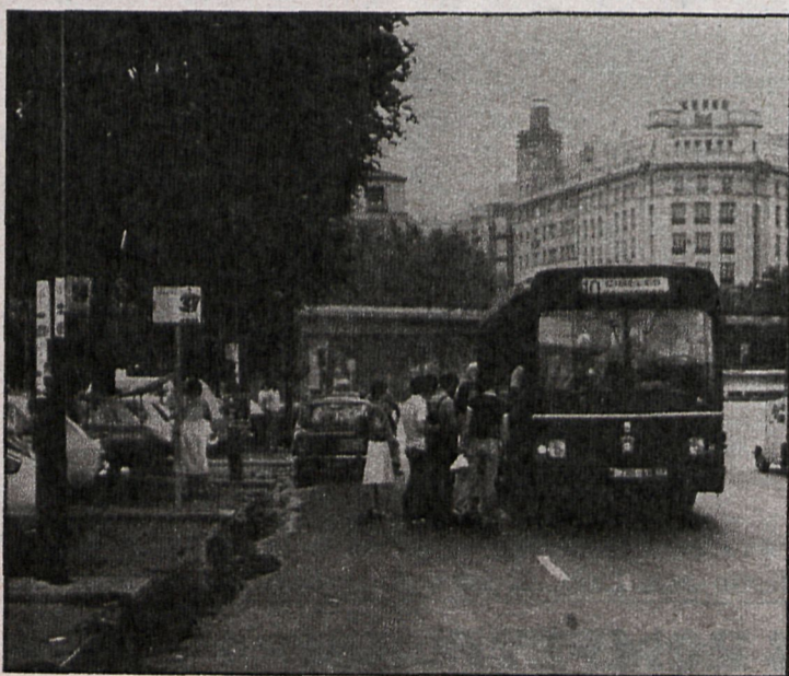
Una ciudad más humana parte de un mejor planeamiento. Consejo de Municipios y Coplaco deberán ponerse de acuerdo

Fijar el crecimiento de Madrid-provincia en torno a los seis millones de habitantes para 1990