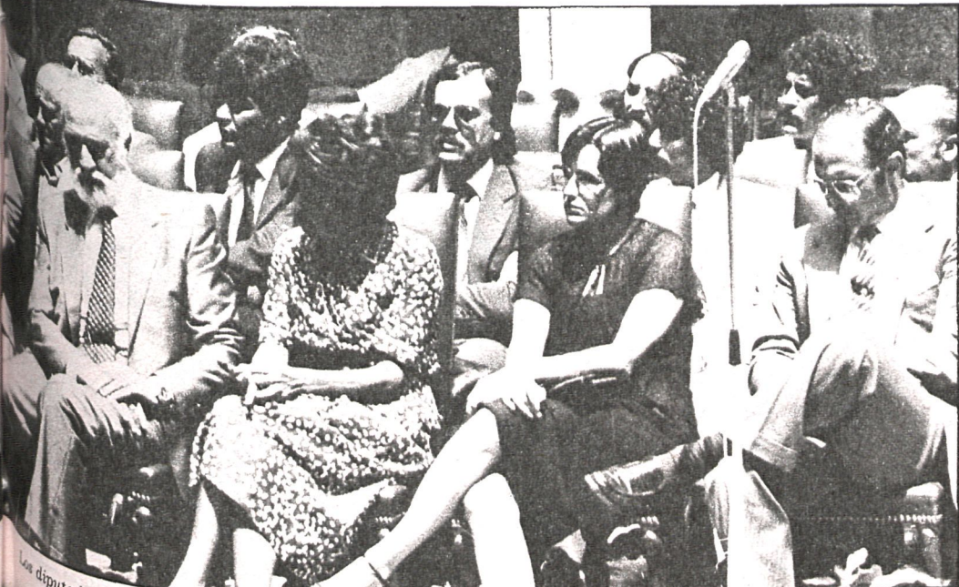
Los diputados provinciales del PSOE y PCE asistieron en bloque a los actos del castillo de Manzanares

La autonomía de Madrid no es solamente un derecho recogido en la Constitución. No es solamente algo concomitante y acorde con los principios