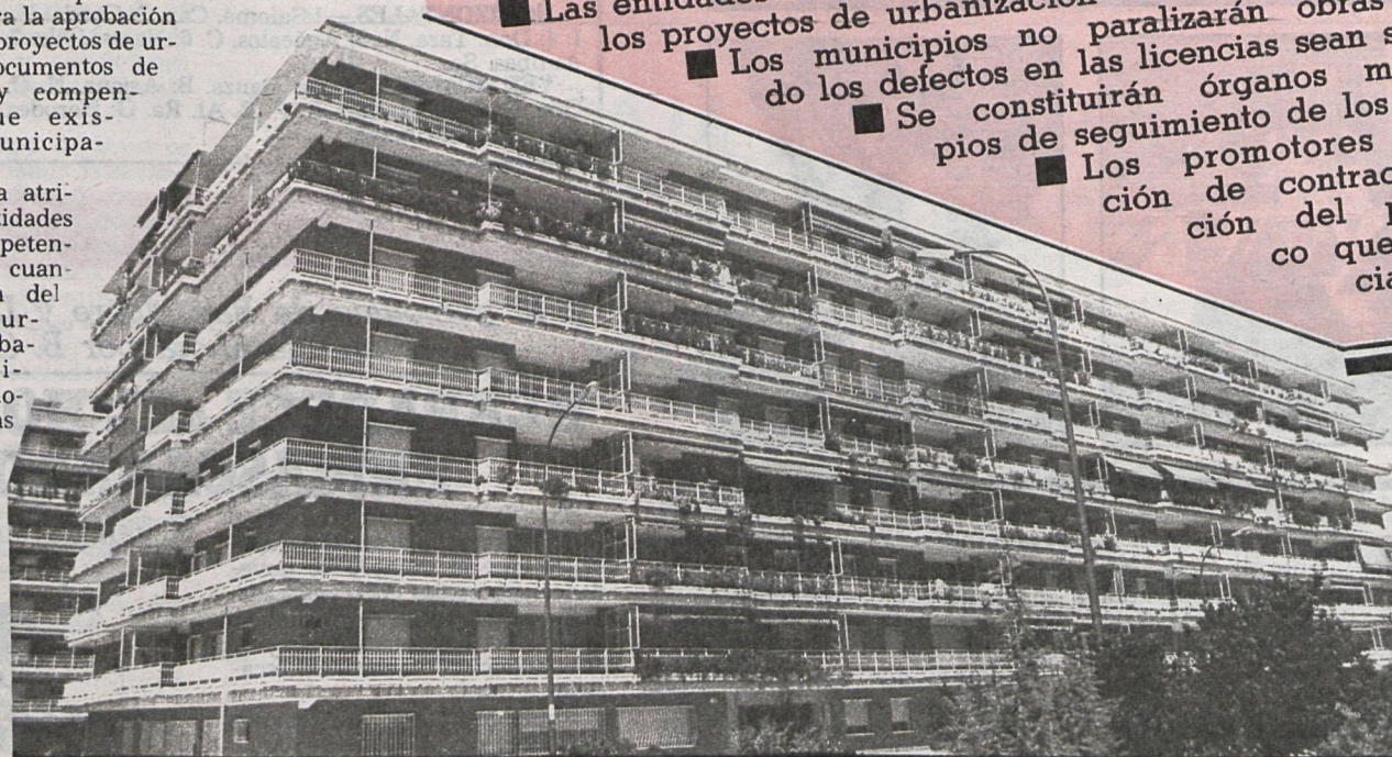
Si existe alguna zona de España donde tendrá una repercusión el acuerdo-marco será precisamente en Madrid y su área metropolitana