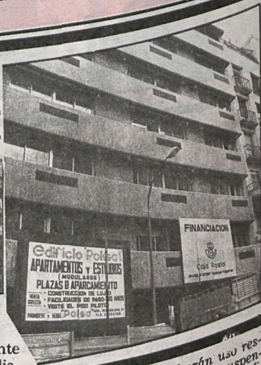
Los ayuntamientos harán uso restringido de la facultad de suspensión cautelar de licencias de edificación en los supuestos de suspensión de licencias