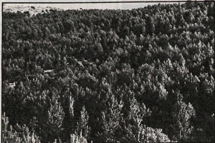
Estas plantas podrían aparecer con distintos colores, permitiendo así su rápida identificación

■ Viene a complementarse estupendamente con las técnicas de teledetección desde satélites artificiales, permitiendo predecir la evolución de una plaga o el tipo predominante de un bosque