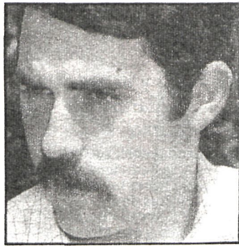
Francisco González, alcalde de Parla

El Ayuntamiento de Parla aprobó, en pleno extraordinario celebrado el pasado día 23, la contratación del equipo CAP (Cooperativa Arquitectura y Planeamiento) para la redacción del Plan General. Hace ya unos meses que fue aprobado un documento sobre «Criterios y objetivos», que debían presidir la redacción del Plan. Con estos dos requisitos el Ayuntamiento da vía libre para que el Plan General sea pronto una realidad.