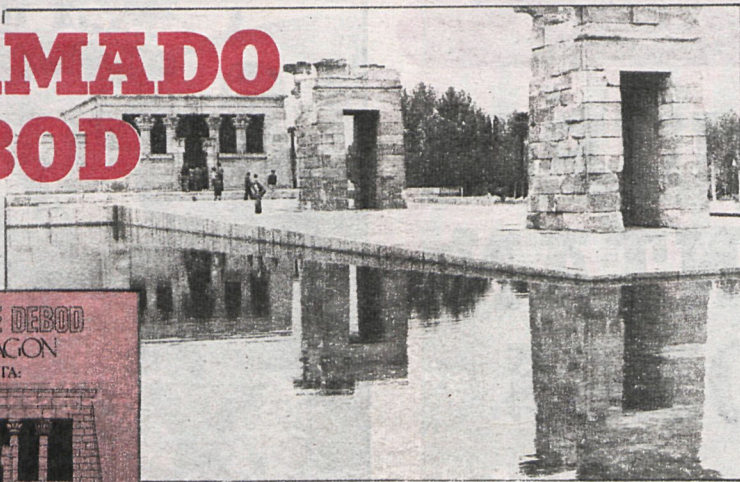
El templo de Debod se ha convertido en un centro cultural de primera línea