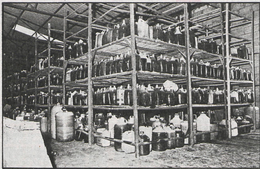
En estas naves hay un millón de litros de aceite venenoso que Insalud está almacenando en Arganda

des para entrar son bastantes, ya que las ventanas del edificio se encuentran a muy baja altura y bastantes de ellas sin cristales ni barrotes que pudieran impedir el robo de bidones y garrafas del aceite tóxico.