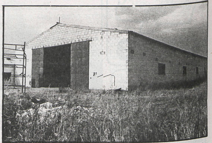
CISNEROS pudo acceder perfectamente a estas naves, que, al parecer, no están suficientemente vigiladas

Estas naves se encuentran en pleno campo y las facilita-